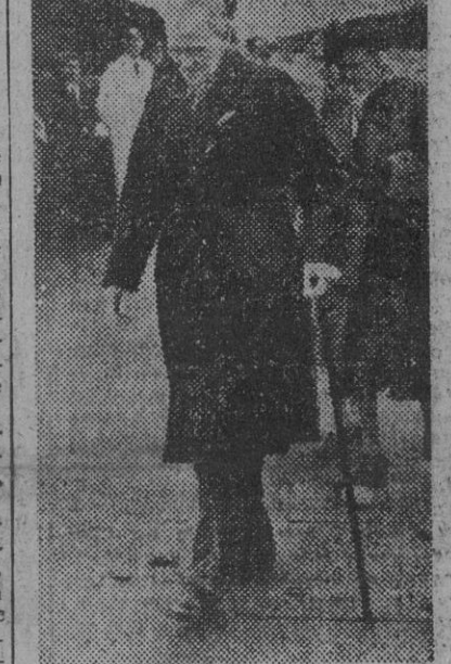
He aquí una de las últimas fotografías del político inglés, sir Stafford Cripps, tomada en el aeropuerto de Londres a su regreso de Zurich, donde había pasado su convalecencia. Le acompaña su esposa.

ZURICH, 22. — El doctor Dagmar Liechti, que asistió a sir Stafford Cripps, había manifestado en la mañana de la posibilidad de que el paciente resistiera todavía una semana.