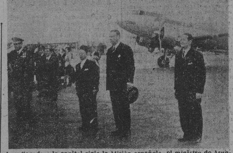
A su llegada a la capital siria la Misión española, el ministro de Asuntos Exteriores, señor Martín Artajo, es recibido en el aeropuerto por el ministro secretario de la Presidencia, Haled Chatila, y otras personalidades civiles y militares.

CAIRO, 22. — El ministro de Asuntos Exteriores español, don Alberto Martín Artajo, ha salido en avión acompañado de los miembros que componen la Misión oficial, con dirección a Yeddah (Arabia Saudita). El avión despegó a las seis de la mañana (hora oficial española). estancia en Damasco del ministro de Asuntos Exteriores. “L’intransigente” dice que la capital siria dispuso un recibimiento triunfal al ministro español, y afirma que el viaje de este alcanza plena significación en el momento de comenzar las negociaciones hispano-norteamericanas, y