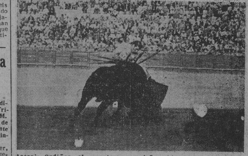
Antonio Ordóñez, el gran torero rondeño, obtuvo ayer un señalado triunfo cortando oreja en la Plaza de la Real Maestranza, de Sevilla. Aquí le vemos toreando de muleta con su magistral estilo en la primera corrida de la Feria, en la que ha reaparecido después de su viaje Hispanoamérica.