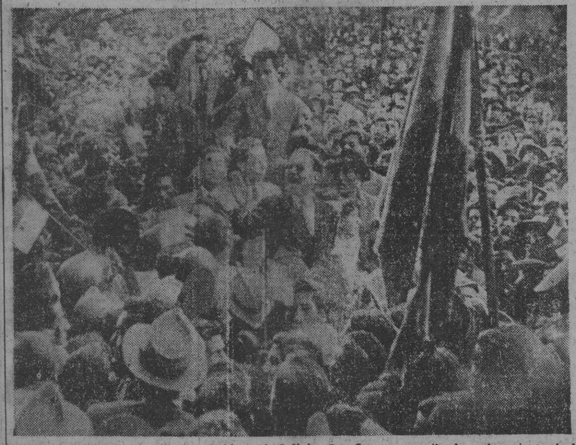
A su llegada a La Paz, el nuevo presidente de Bolivia, Paz Estensoro, recibe las acclamaciones de la multitud simpatizante del movimiento revolucionario que él acuadilla.