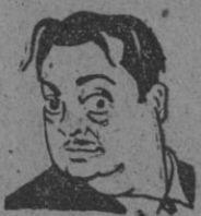
Mario Mattoli, el admirado realizador de "A las 9, lección de química", "Esa noche no hay nada nuevo", "La vida vuelve a empezar" y otras muchas películas en las que puso de relieve su afán creador dentro de los cánones del cine, ha sentido la atracción de la actual tendencia del cine italiano, que toma sus asuntos en la vida de la calle y eleva a la categoría de personajes sencillos tipos del