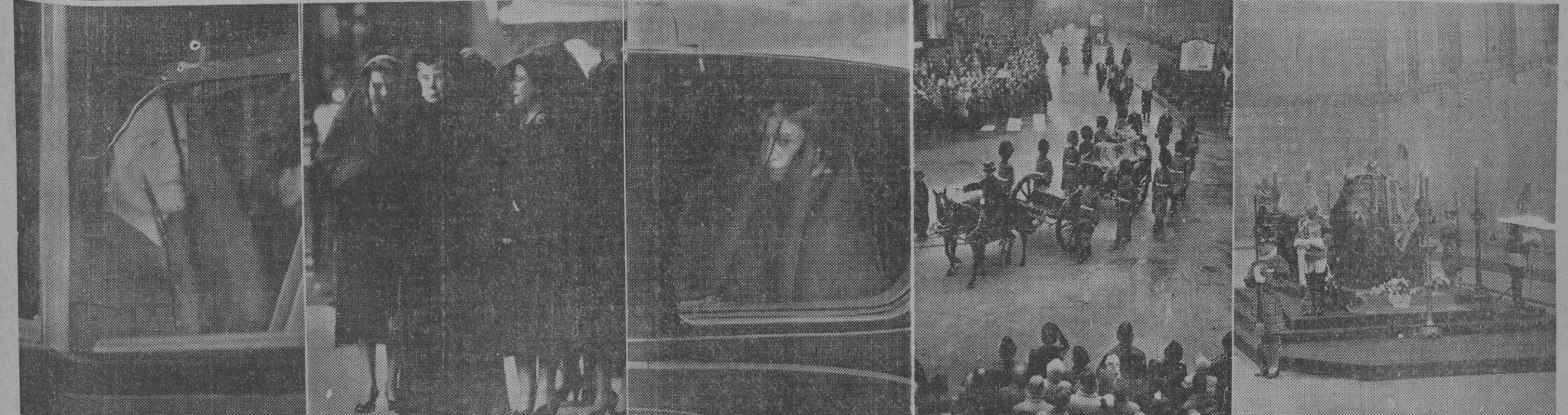
Recogemos en esta información gráfica varios aspectos del traslado de los restos mortales del rey Jorge VI desde Sandringham a Londres. 1. La reina viuda, con la cara cubierta con un velo, se dirige desde el palacio de Buckingham a la Abadía de Westminster, para recibir los restos de su difunto esposo. — 2. La reina madre, la reina viuda y la nueva reina, esperan en la Abadía, la llegada del cadáver. — 3. Isabel II de Inglaterra, cubierta con su madre con un velo. — 4. El arnés de artillería con el féretro del rey Jorge VI, pasa por las calles de Londres camino de la Abadía de Westminster donde se halla depositado el cadáver del monarca hasta mañana que se efectuará el entierro.