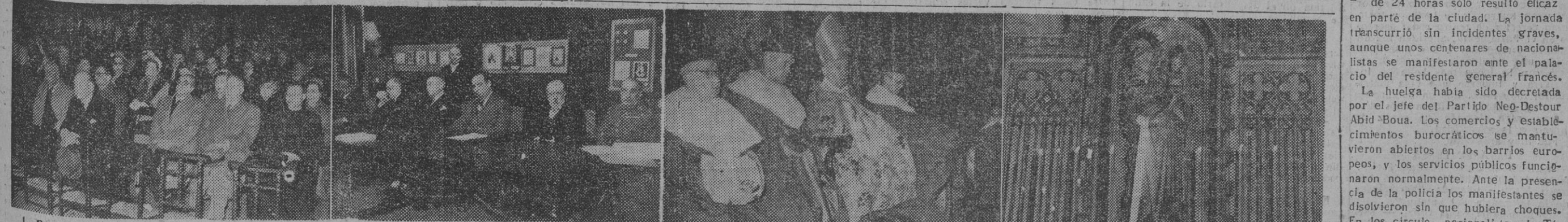
1. Presidencia del solemne funeral celebrado esta mañana, en la Santa Iglesia Catedral, en memoria del gran bacteriólogo doctor don Jaime Ferrán Clúa, con motivo de conmemorarse hoy el centenario de su muerte. — 2. Un momento de la entrega de premios de la Exposición de Bellas Artes. — 3. El señor obispo de la diócesis, doctor Modrego, oficiando en la ceremonia religiosa de esta mañana, en la Catedral, con motivo de la festividad de la Candelera. — 4. Detalle de uno de los altares de la Basílica, adornado con artísticas velas, ofrecidas por los fieles.