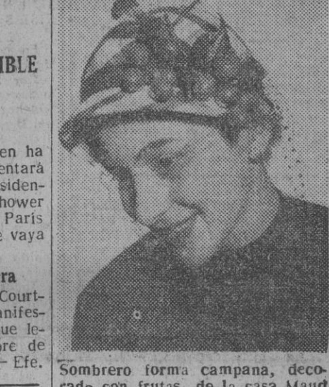
Sombrero forma campana, decorado con frutas, de la casa Maud y Nano, de París. Moda de esta primavera próxima.