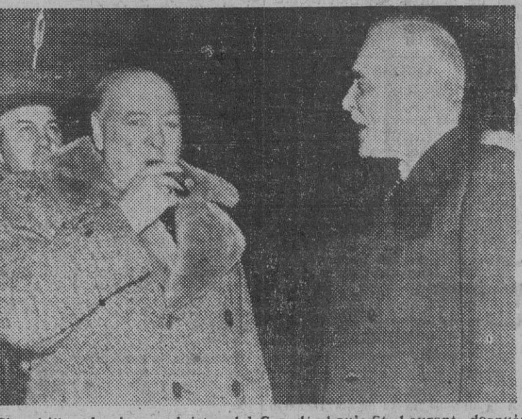
Churchill y el primer ministro del Canadá, Louis St. Laurent, después de almorzar en Ottawa, el pasado día 13, durante la visita del primer ministro inglés.