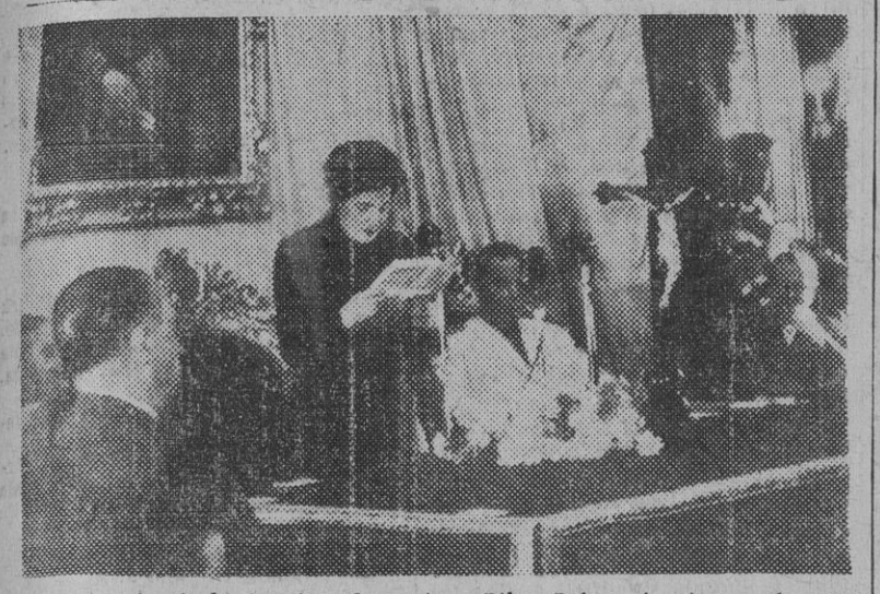
La delegada de la Sección Femenina, Pilar Primo de Rivera, durante su discurso en el acto inaugural del Consejo Nacional de la Sección Femenina, celebrado en el salón de la Diputación Provincial de Cádiz