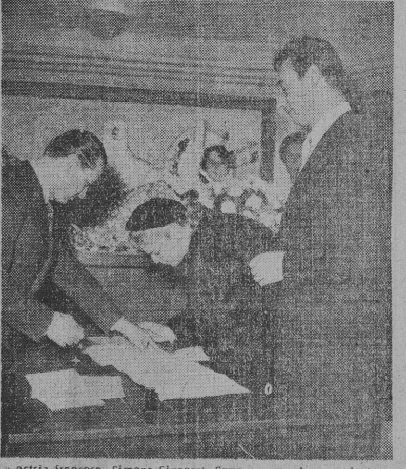
La actriz francesa, Simone Signore, firma su acta de casamiento en la iglesia de San Paul de Vence, en París, con el cantante Ivo Montano...