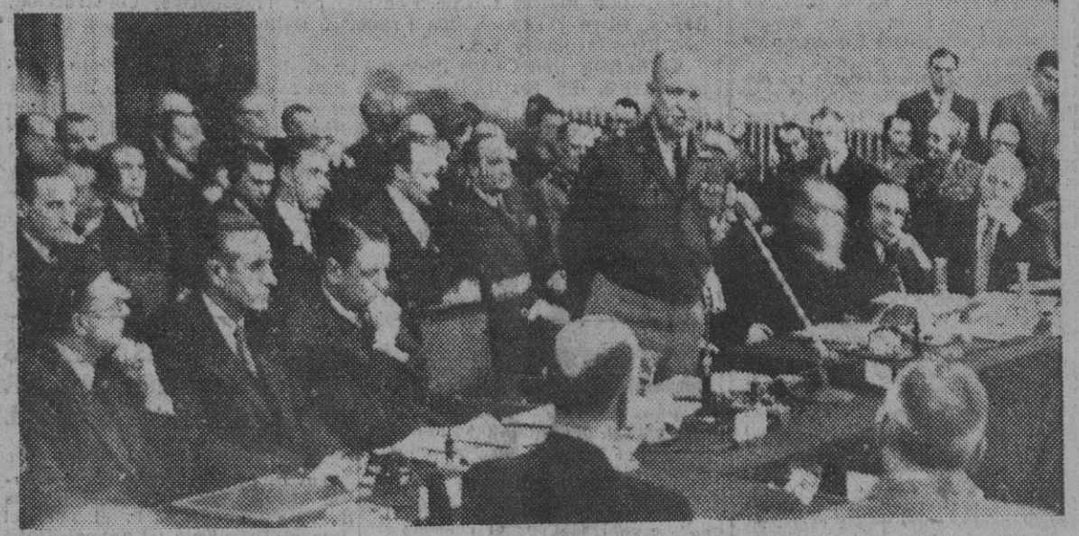
El general Eisenhower, comandante supremo atlántico, habla en Roma, ante dicho Consejo, el pasado día 26, acerca del uso de los elementos atómicos para defender Europa. El general dijo: "Cada uno, incluso los EE. UU., puede hacer más".

El consejo del Pacto de Atlántico reunido en Roma