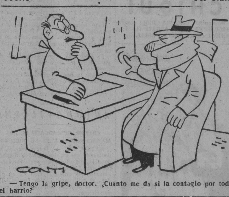
—Tengo la gripe, doctor. ¿Cuanto me da si la contagio por todo el barrio?