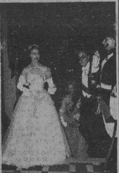
La princesa Margarita de Inglaterra, acompañada de sir Oliver Harvey, embajador de Gran Bretaña en París, al salón de baile del Circulo Internacional de la capital parisina, para asistir a un festival a beneficio del "Hertford British Hospital". El acto se celebró el pasado día 21.

El mariscal Pibul proyecta modificar el régimen semidemocrático e instaurar una semidictadura militar