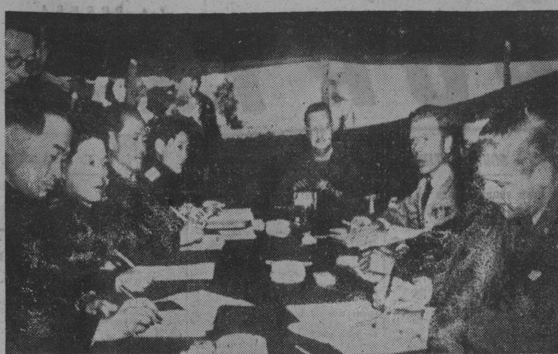
He aquí a los delegados norcoreanos y a la representación de la O. N. U. durante las conversaciones celebradas en Panmunjon para determinar los puntos del armisticio en Corea. A pesar de los grandes esfuerzos para concertar el "alto el fuego", todavía no se ha llegado a un completo acuerdo.