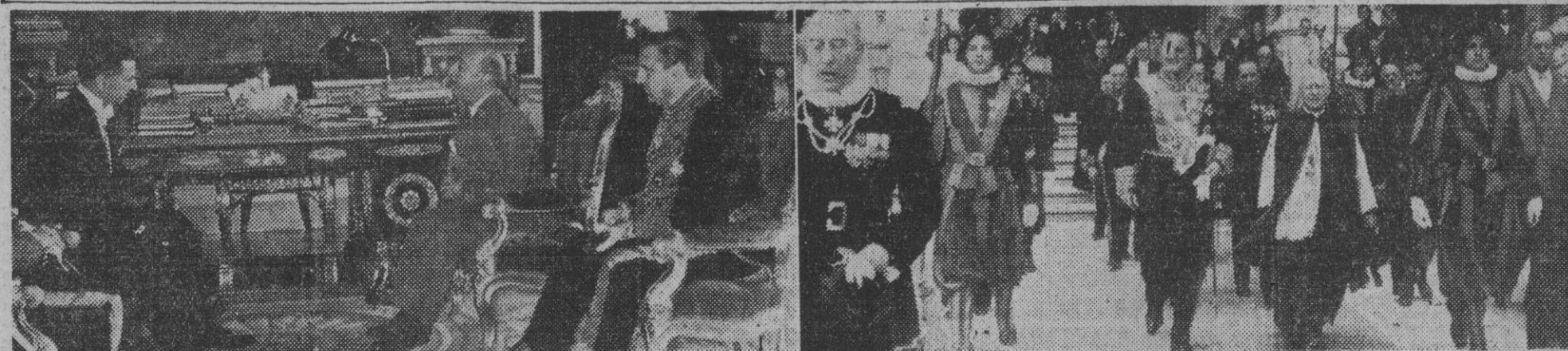
1. S. E. el Jefe del Estado saluda a M. Du Toit, ministro plenipotenciario y primer representante diplomático de la Unión Sudafricana en España, con motivo de la presentación de sus credenciales, ayer, en el palacio de El Pardo. — 2. El embajador de España, don Fernando María Castiella, sale de la Basílica vaticana después de haber venerado el sepulcro de San Pedro, en el día de presentación de cartas credenciales a Su Santidad Pío XII. — (Fotos Cifra)