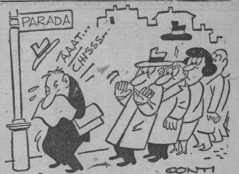
El temor al contagio.