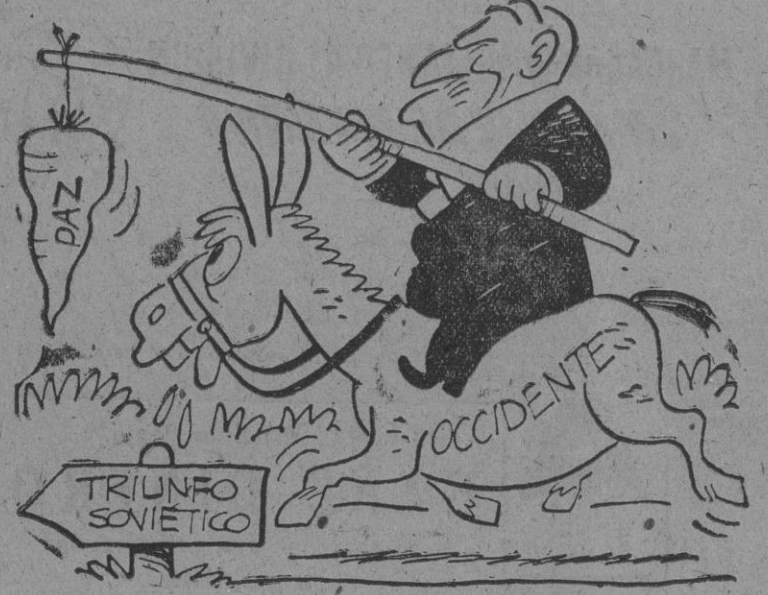
El "hermoso" programa de paz de Vichinsky.