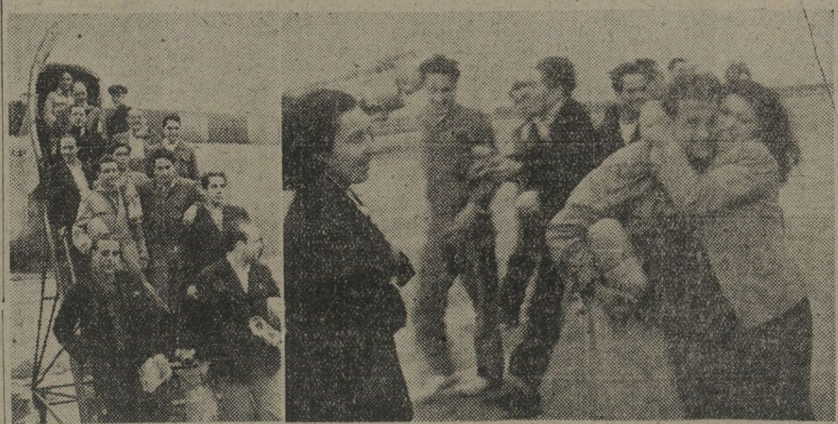
Ayer llegaron al aeropuerto del Prat los naufragos del buque español "Nuria R.", que se hundió recientemente entre el Cabo Villano y Toriñana. A su llegada al aeropuerto, donde eran esperados por sus familiares, se produjeron escenas conmovedoras como la que recoge la segunda fotografía.