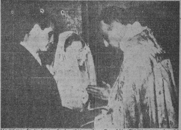
Momento de la boda de la rejonadora Conchita Cintron con el noble portugués don Francisco Daqamara Decastelo Branco, en la capilla de Junqueira, en Lisboa, el pasado día 5.