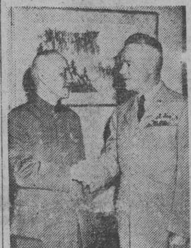
El generalísimo chino Chiang Kai-Shek saluda en su residencia de invierno de Taipei al jefe del Estado Mayor del Ejército americano, general Lawton Collins, que llegó a Formosa en viaje oficial.

Chiang Kai-Shek recibe al general norteamericano, Collins