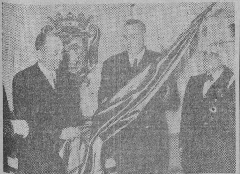
El alcalde de Madrid entregando al capitán de la motonave "Villa de Madrid", la bandera y escudo que la capital de España ofrece a dicho buque. Al acto han asistido nuestras primeras autoridades y el presidente de la Diputación de Madrid, marqués de la Valdavia.

Nadie está al margen de la gestión municipal. La belleza de nuestra ciudad, sus transportes, gran parte de sus abastecimientos, su pavimentación, los servicios telefónicos, de agua, gas, electricidad y tantos otros dependen de aquélla; nadie carece de puntos de contacto con la labor fundamental del Ayuntamiento a que pertenece. Quien se aparte de las elecciones municipales, descuida y abandona sus propios intereses, los de su familia y los de su ciudad