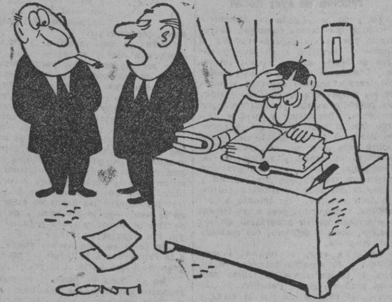
—Su hijo está siempre estudiando. Se ve que tiene ambición. —Si, quiere llegar a ser campeón de crucigramas.

Los marqueses de Villaverde, a Estocolmo