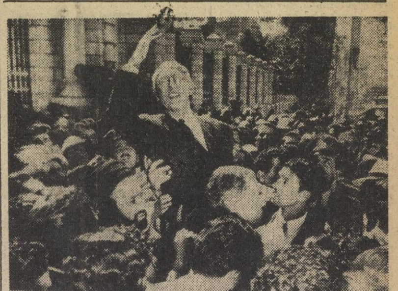
Mossadeq, en las calles de Teherán, pronuncia discursos sobre la cuestión del petróleo