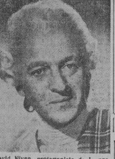
David Niven, protagonista de la producción en technicolor "El último Estuardo", que, presentada por Edici, será estrenada esta noche en el Tivoli