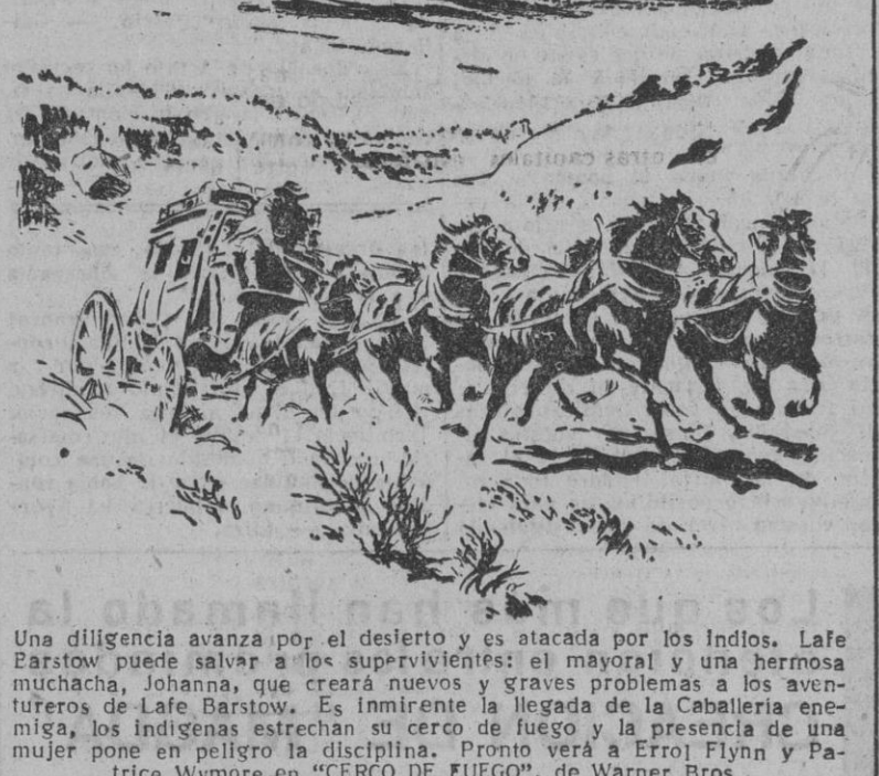
Una diligencia avanza por el desierto y es atacada por los Indios. Lefe Barstow puede salvar a los supervivientes: el mayoral y una hermosa muchacha, Johanna, que creará nuevos y graves problemas a los aventureros de Lefe Barstow. Es inminente la llegada de la Caballería enemiga, los indios estrechan su cerco de fuego y la presencia de una mujer pone en peligro la disciplina. Pronto verá a Errol Flynn y Patricia Wymore en "CERCO DE FUEGO", de Warner Bros

COMEDIA En su tercera semana triunfa clamorosamente LLAMA UN INSPECTOR Una obra originalísima, de palpitante interés y una genial creación de GUILLERMO MARIN MARIA JESUS VALDES RAFAEL BARDEM GABRIEL LLOPART