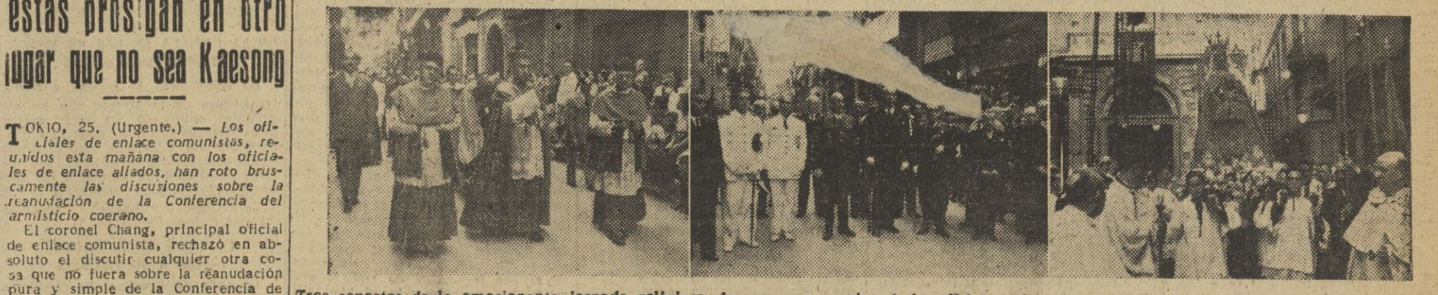
Tres aspectos de la emocionante jornada religiosa de ayer con motivo de la salida por las calles de la ciudad de nuestra gloriosa Patrona: 1. El Excmo. y Rvdmo. señor obispo, que presidió la procesión, imparte su bendición a los numerosos fieles que contemplaban el paso de la imagen. — 2. Las primeras autoridades de la provincia y de la ciudad, en la procesión. — III. Salida de la imagen de su templo. — (Fotos Pérez de Rozas)