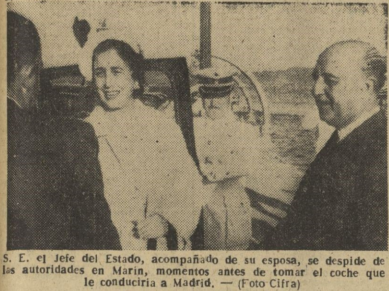
S. E. el jefe del Estado, acompañado de su esposa, se despide de las autoridades en Marin, momentos antes de tomar el coche que le conduciría a Madrid. — (Foto Cifra)