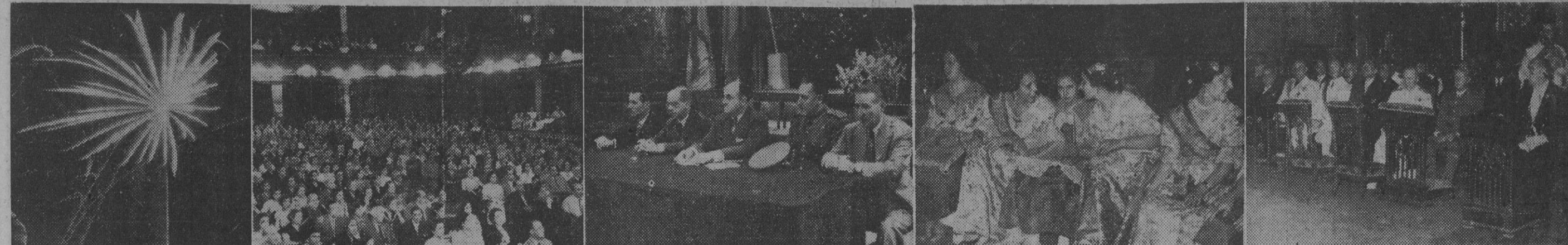
Recogemos en esta información gráfica diversos momentos de los festejos y actos celebrados en nuestra ciudad con motivo de las Fiestas de la Merced. — I. Disparo de fuegos de artificio en el recinto de Montjuich. — II y III. Aspecto que ofrecía el Palacio de la Música durante la fiesta de ex Cautivos y presidencia del mismo acto. — IV. Muchachas ataviadas con el traje regional de Valencia durante el festival celebrado en el Pueblo Español. — V. Presidencia oficial de la Función religiosa en la Merced.