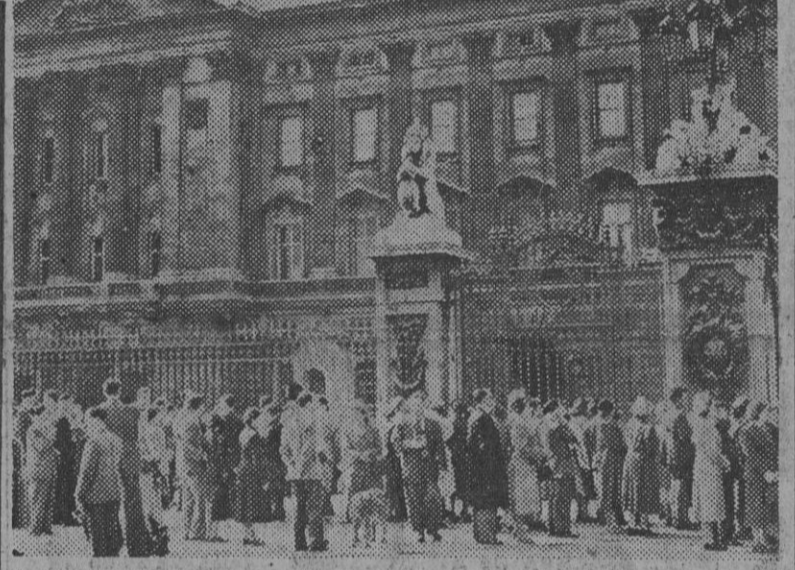
Numerosos ingleses reunidos frente al Palacio de Buckingham para interesarse por la salud del rey Jorge.

LONDRES, 24. — El rey Jorge VI de Inglaterra fué operado a última hora de la mañana de ayer. El estado del monarca inmediatamente después de la intervención quirúrgica era satisfactorio. — Efe. Se extiende la versión de que el soberano está grave LONDRES, 24. — Tan pronto como fué publicado el texto del comunicado oficial sobre la operación llevada a cabo en la persona del rey Jorge se ha extendido la impresión de que el enfermo se encuentra grave y que la intervención quirúrgica no ha sido totalmente satisfactoria. Se recuerda en Londres que cuando el monarca sufrió otra operación, el 12 de marzo de 1949, debido al mal que le aquejaba en una pierna, el comunicado de entonces decía claramente: "Se ha llevado a cabo, con éxito, una operación de simpatectomía lumbar en la persona del rey y en el palacio de Buckingham". La opinión general es que la situación es de extrema gravedad.