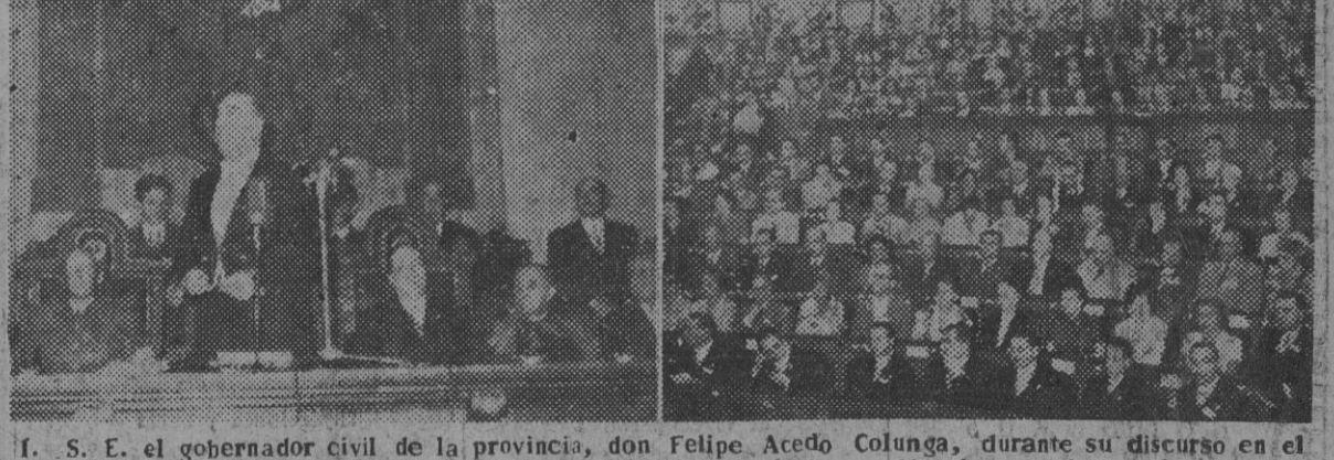
S. E. el gobernador civil de la provincia, don Felipe Acedo Colunga, durante su discurso en el acto de apertura del II Congreso Internacional de Reumatología. — III. Aspecto de la sala, llena de congresistas.