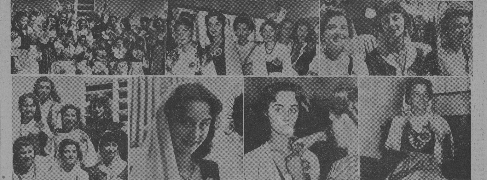
Esta mañana han llegado a Barcelona, a bordo del trasatlántico "Con te Grande", 22 bellezas italianas. En la presente información gráfica puede apreciarse la belleza de estas 22 muchachas, que representan a diversas regiones de Italia y participarán en el Concurso de San Remo para la elección de "Miss Italia 1951".