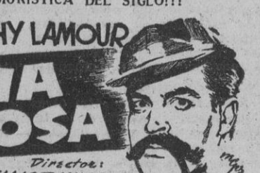
Bob Hope + Dorothy Lamour

¡CARCAJADAS Incontenibles ante las vicisitudes de Bob que ponen carne de gallina!