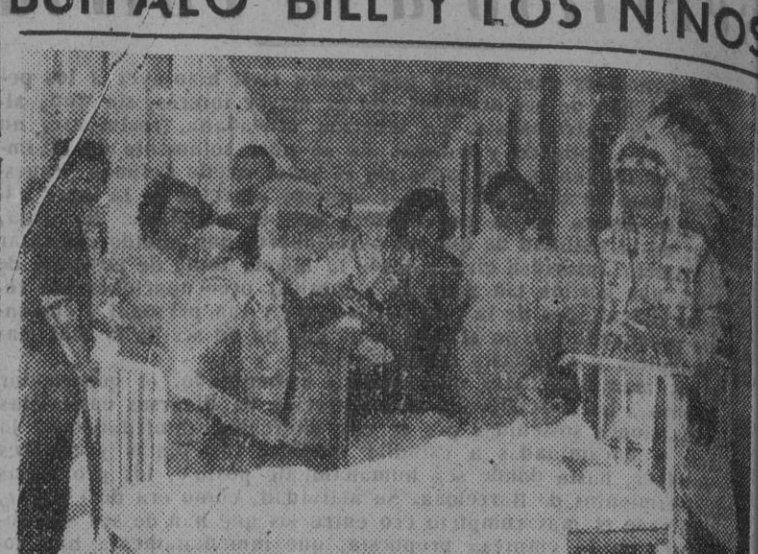
Buffalo Bill, el legendario personaje del Circo Americano...