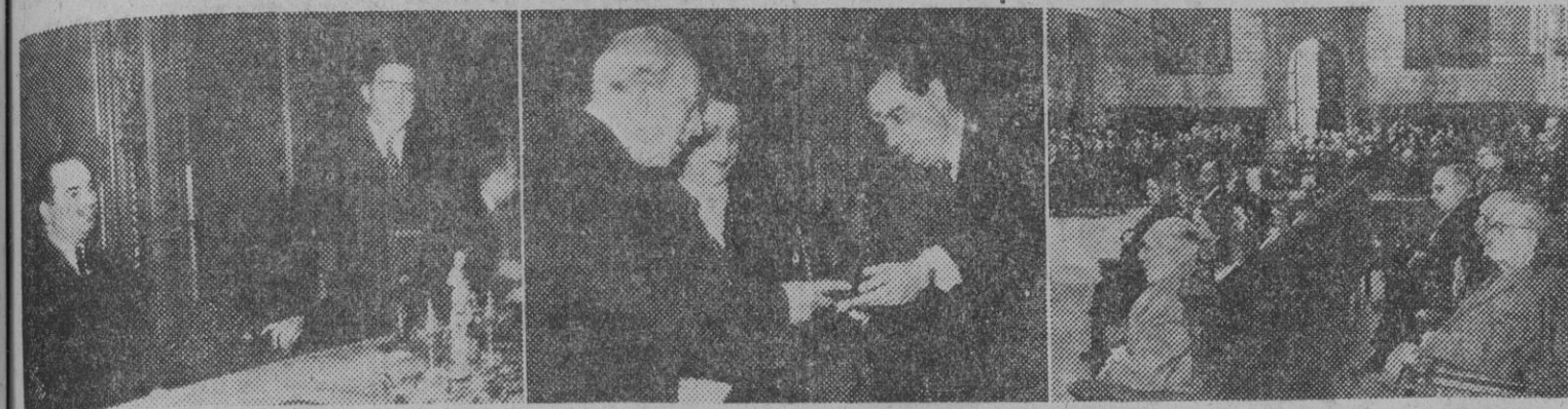
El director general de Bellas Artes, marqués de Lozoya, durante el discurso pronunciado con motivo del solemne acto celebrado en el Salón de Ciento. — 2. Entrega de la Medalla de Oro de la Ciudad a la institución artística barcelonesa "Amigos de los Museos" por el Sr. Ferrer. — 3. Una vista del Salón durante el discurso del marqués de Lozoya.

AYER, EN EL SALON DE CIENTO DEL PALACIO MUNICIPAL