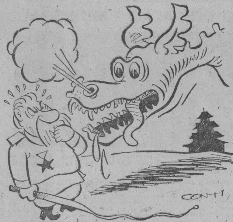
— ¡A ver si con tanto excitarse se me come a mi también!