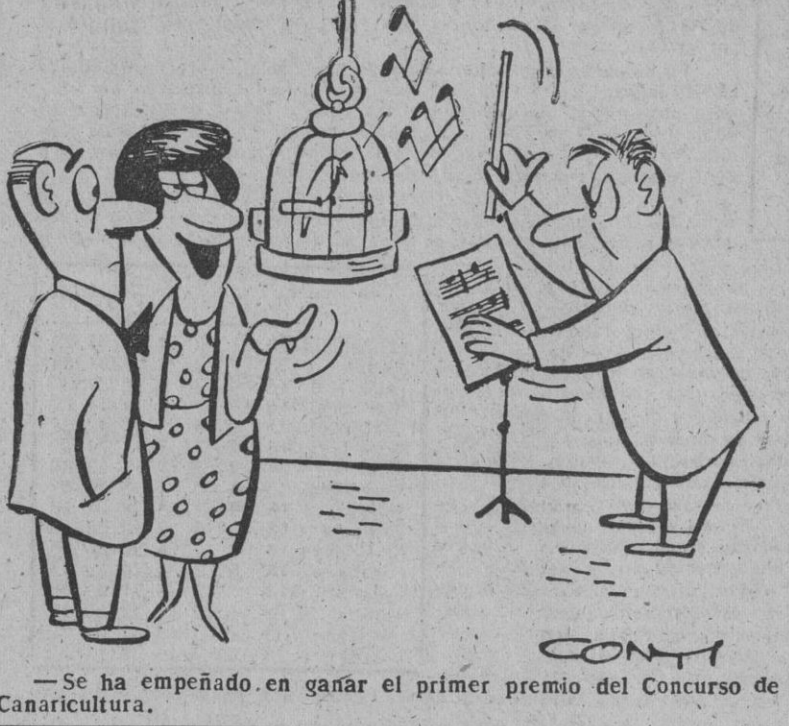
—Se ha empeñado en ganar el primer premio del Concurso de Canaricultura.

FRENTE DE COREA, 20. — Las patrullas señalan que los chinos se concentran hacia el oeste de Inchon. Los informadores indican que estas concentraciones chinas alcanzan efectivos de compañías y batallones. Las tropas chinas y nortecoreanas exhortan a los refugiados, a que regresen a sus hogares, "porque nada arriesgan penetrando en la zona de las Naciones Unidas o en la zona comunista". Un portavoz militar comentó que esta apelación tiene por finalidad que los refugiados entren en la zona de combate para crear la confusión. Las fuerzas comunistas atacaron esta mañana a una unidad aliada que transportaba abastecimientos para los elementos de la O. N. U. en la región de Wonju. Cerca de Kongjol un sargento nortecoreano y 50 de sus hombres han sido hechos prisioneros. El sargento ha declarado su pertenencia a la XXXII División. Las declaraciones de los prisioneros indican que 10.000 comunistas intentan concentrarse en la región al norte de Andong, tras las líneas de la O. N. U. — Efe.