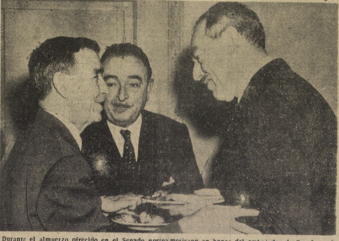
Durante el almuerzo ofrecido en el Senado norteamericano en honor del embajador de España y de la señora de Lequerica, conversan el senador Chavez (izquierda), el señor Lequerica y el secretario de Estado, señor Acheson.

"Pensamos mantenernos en Corea mientras la ONU decida su actitud" "Fuimos objeto de un ataque, mucho más infame que el de Pearl Harbour, pero nuestro ejército se ha mantenido resueltamente invicto"