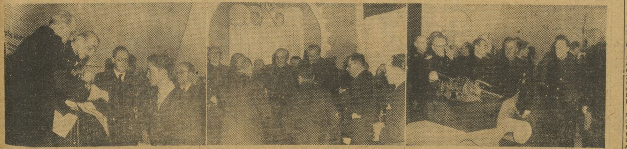
Con motivo del X aniversario de la fundación del Frente de Juventudes se celebraron en Madrid importantes actos a los que asistió S. E. el Jefe del Estado y de los que en su día dimos completa información. Hoy ofrecemos este reportaje gráfico en cuyas dos primeras fotos se ve al Caudillo que, acompañado del camarada Elola, hace entrega de los trofeos y premios a los campeones del Torneo Ibérico. Después, S. E., acompañado de los ministros y otras autoridades y jerarquías, visita la VII Exposición Nacional de Arte del Frente de Juventudes.