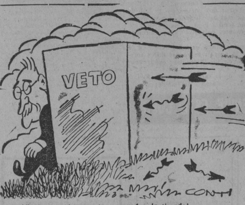
—¡Mientras yo tenga esto ya pueden ir tirando!