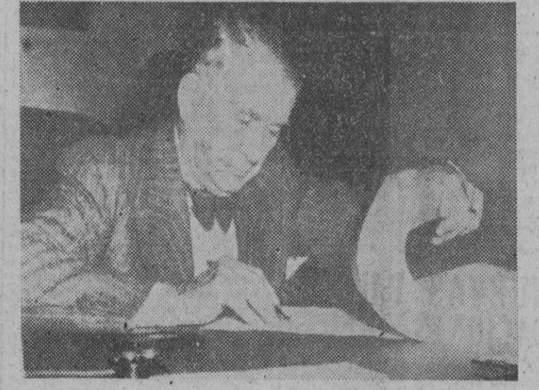
El vicepresidente Berkeley, en el momento de firmar la ley de créditos en la que se incluyen 62 millones de dólares para España

Veinte comunistas filorrusos han sido detenidos en Zagreb