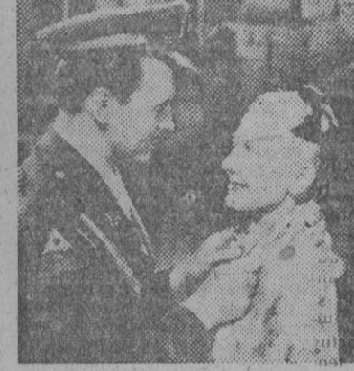
Jean Arthur y John Lund, en una escena de "Berlín-Occidente", que se estrenó ayer en los cines Astoria y Fémima