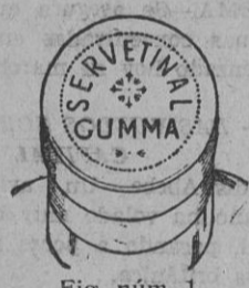
Fig. núm. 1

Esta cápsula es plateada por dos lados y granate en su parte superior, con una inscripción en relieve formada por el mismo metal de la cápsula que dice "SERVETINAL GUMMA", la palabra SERVETINAL de forma circular y la palabra GUMMA resta debajo de la que dice SERVETINAL. (Véase fig. núm. 1).