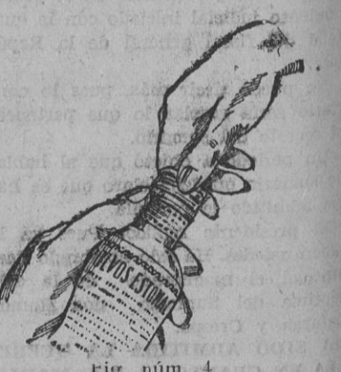
Fig. núm. 4

POR CONSIGUIENTE, TODO FRASCO QUE NO LLEVE LAS CAPSULAS CUYAS CARACTERISTICAS Y GRAFADOS INSERTAMOS, SEGUN FIGURAS 1 Y 2, PARA MAYOR CONOCIMIENTO DEL PUBLICO, DEBE SER RECHAZADO, PUES EN ESTE CASO SE TRATARIA DE UNA FALSIFICACION. ASIMISMO RECHACE EL "SERVETINAL" VENDIDO A GRANEL, PUES TAMBIEN ES FALSO.