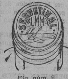
Fig. núm. 2

Esta cápsula es totalmente plateada o sea del mismo color natural del estaño; en su parte plana superior o cabeza ostenta una inscripción en relieve formada con tinta de color encarnado que dice "SERVETINAL GUMMA" y debajo de esta inscripción la firma del autor. (Véase figura núm. 2)