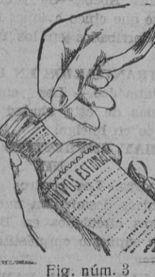
Fig. núm. 3

En su parte lateral adaptada al cuello de la botella se ha practicado un corte con dos puntas, y tirando por cualquiera de ellas quedará la cápsula convertida automáticamente en un tapón de rosca. (Véanse figuras números 3 y 4).