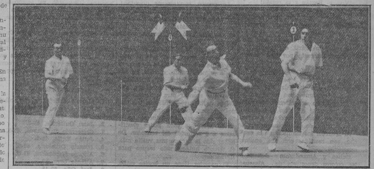
DE LA FINAL DEL CAMPEONATO DE MANO.-Un interesante momento, de gran riqueza plástica, en el partido final.

A la vista de ese gol los jugadores forasteros recurren al juego bronco y "sucio".