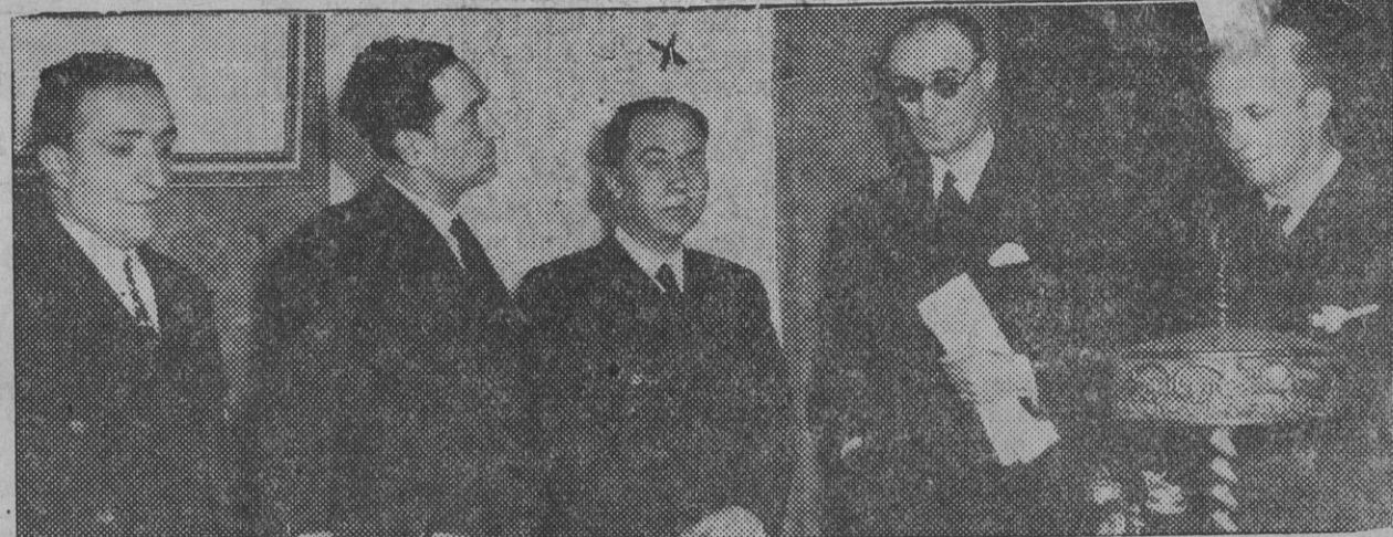
Don Mariano Menor Foblador a poco de recibir el mando del Gobierno de Navarra de manos de don Rufino García Larrache, que lo ha desempeñado interinamente.

les plantea un problema de necesidad, que, casi siempre, tiene otras soluciones más técnicas, más racionales, más previsoras, pero que se rehuye su planteamiento y conclusión, porque quizá exija un mayor esfuerzo individual o colectivo y, más bien, porque así lo entiende mejor el criterio cacique y patán. Entonces, me dirás, ¿para que sirven los técnicos y qué hace la Diputación que no saben impedir estas obras destructoras del capital que heredaron de sus mayores? Fácil es de contestar: no sirven para nada; aquellos porque es inútil su saber, que no prevalece; y ésta porque hace uso del Fuero de modo absurdo y rural. Es triste pero es cierto, que Navarra se ve abocada a la intervención del Estado en esta cuestión forestal; pero ante tanta labor destructora de nuestros montes, ¿qué navarro no teme la intervención estatal? ¿Es esto gobernar? ¿Talar los montes, romper las laderas, es gobernar? Has de venir lector, conmigo por Navarra, y tú mismo vas a comprobar la verdad de esta obra destructora, que tú y yo, y con los dos Navarra, no supimos impedir. *** ¡Hayas de Lezaun! Ya no formáis el bosque que recreaba los ojos de mirada noble, ya no sois símbolo de cultura y en el Llano no existe fronda. ¡Maldito sea el cacique! ¡Maldito sea el patán! JUAN DEL HAYEDO.