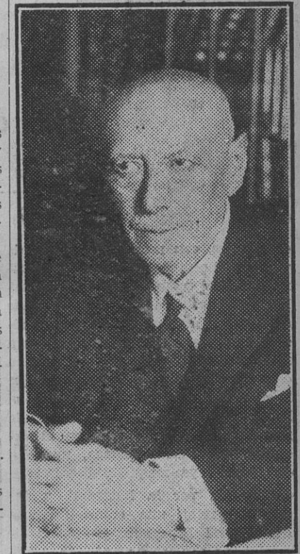
Fotografía reciente del ilustre compositor don Joaquín Larregla.