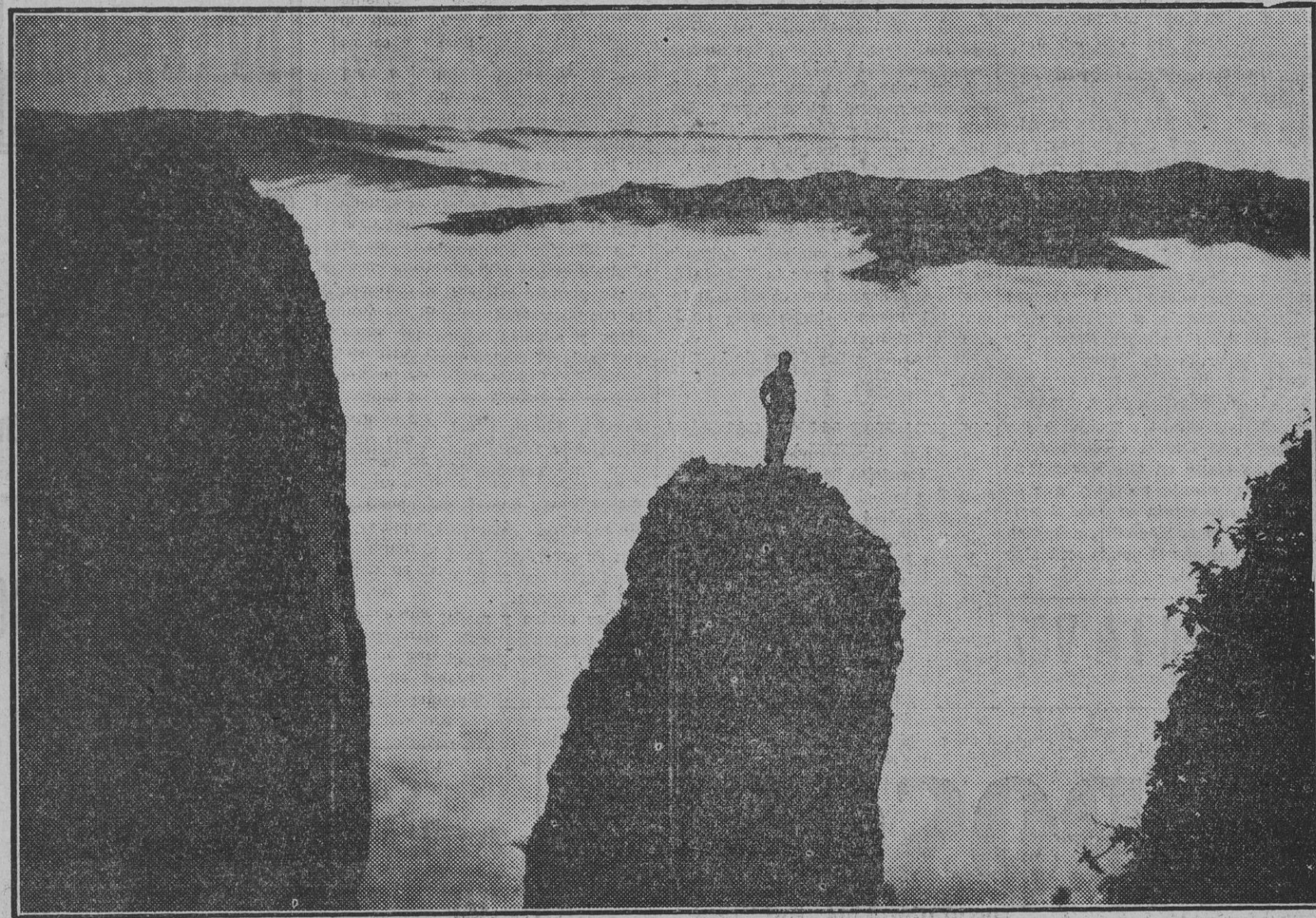
Fuerte contraluz obtenido en la Peña de Echauri. Sobre el monolito de primer término puede verse a un intrépido socio de Montañeros de Navarra