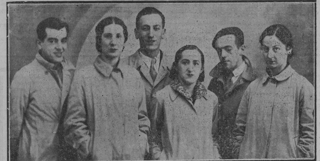
Parte de los elementos dirigentes e instructores de los Gaztetxus, a cuyo esfuerzo y entusiasmo se debe el reciente éxito de tan simpática institución en Iruña

ramos...! Pero son tantas las dificultades que por el momento se oponen que no tenemos todavía un plan concreto.