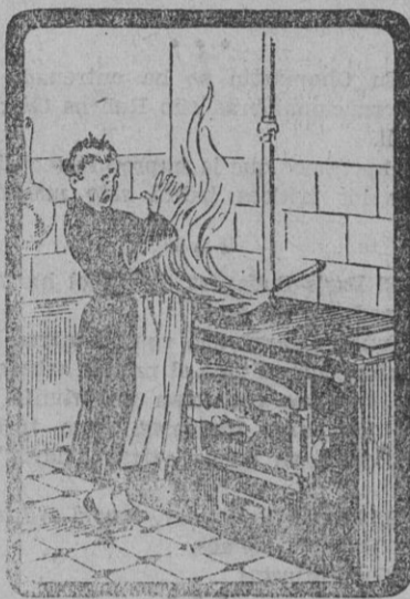
UN BUEN CONSEJO