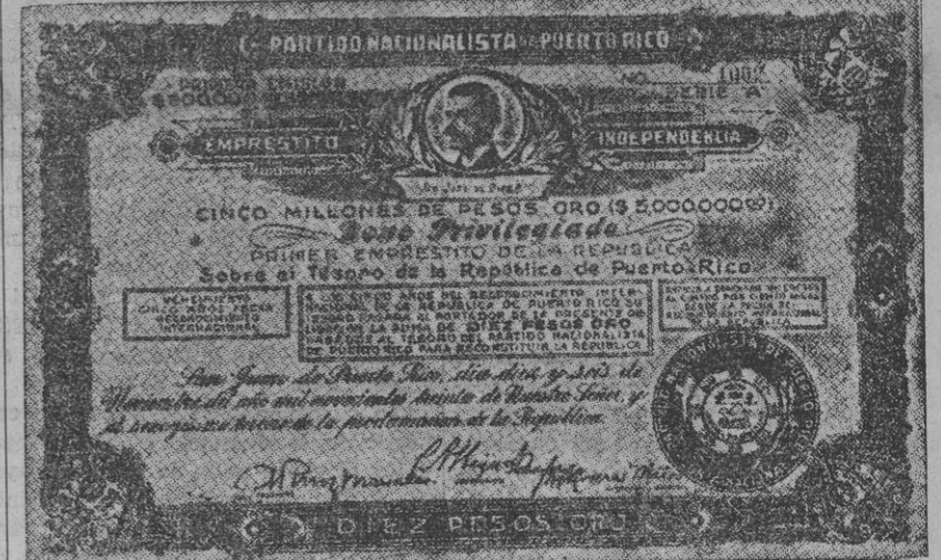
Uno de los bonos por valor de diez dólares del empréstito de cinco millones lanzado por el partido nacionalista de Puerto Rico.