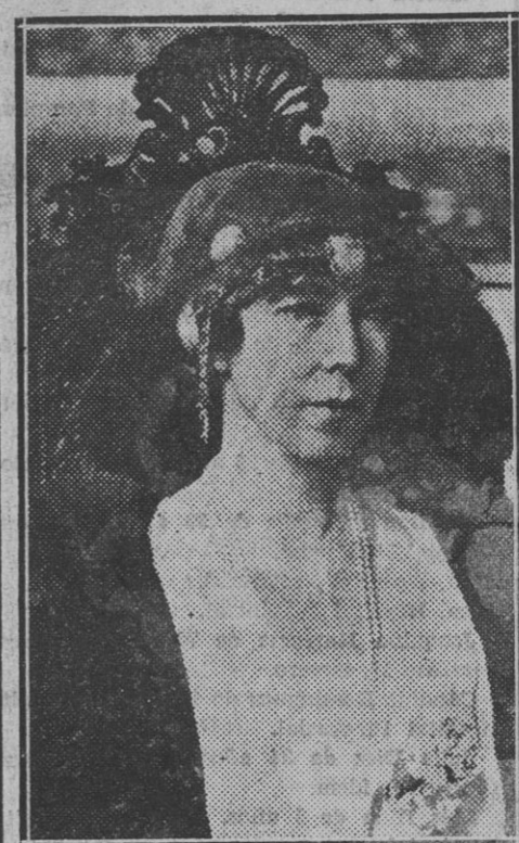
La que fué reina de los belgas y con ellos compartió los horrores de la guerra y la alegría del triunfo ha ido a encerrarse en un convento de Viena para buscar consuelo al dolor de haber perdido a su rey y compañero