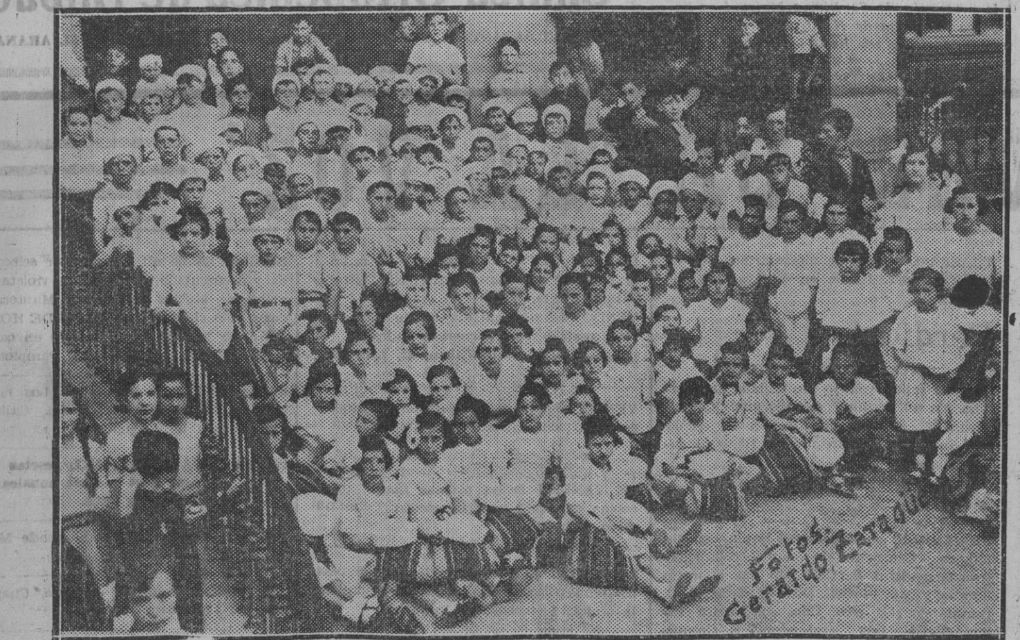
Ayer marchó a Fuenterrabía la tanda de las Colonias Escolares que inaugurará el soberbio edificio levantado para la obra en aquella ciudad. La foto recoge el grupo de los pequeños colonos ante la puerta de las Escuelas de San Francisco instantes antes de realizar la partida.