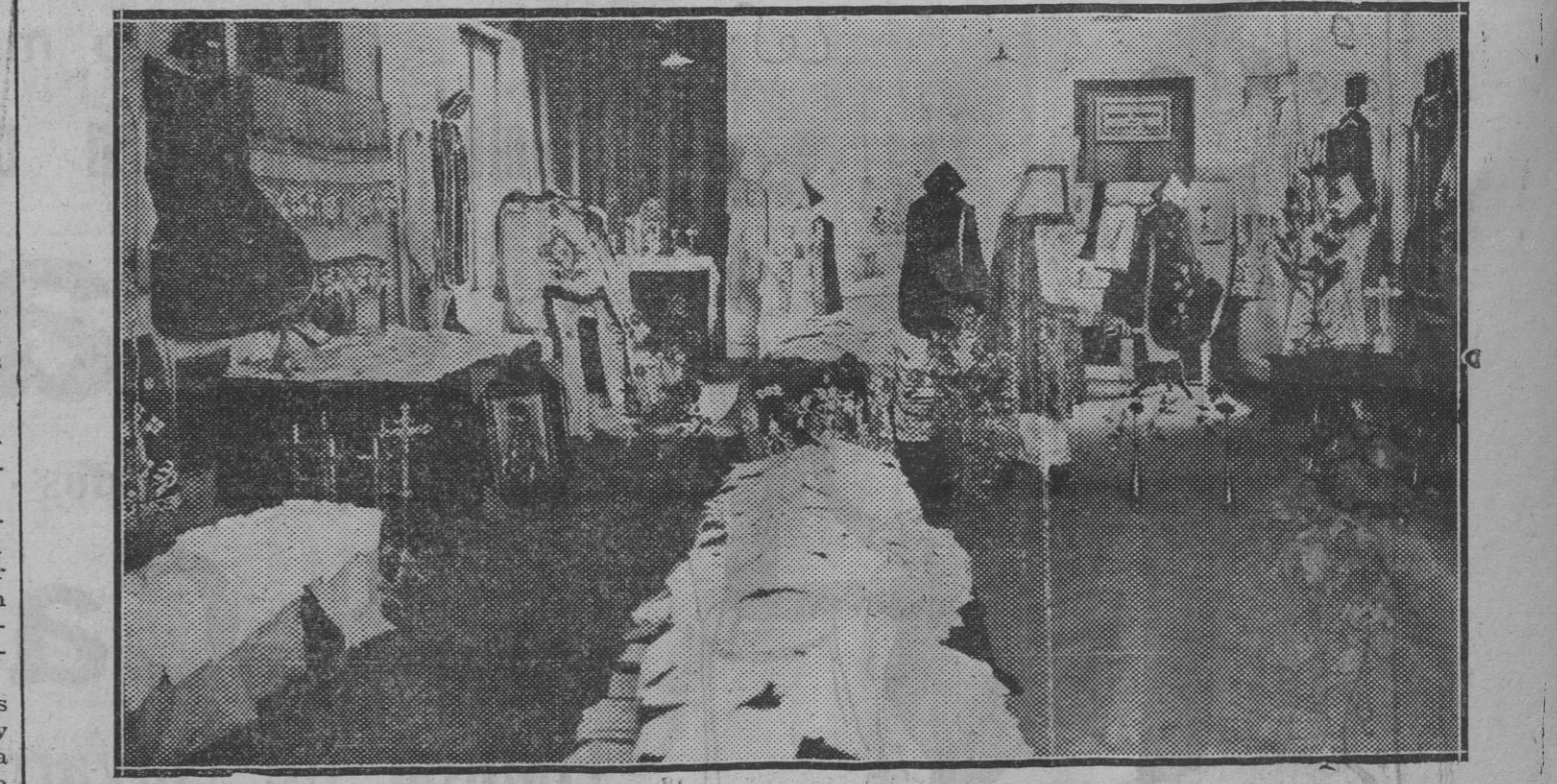
EN EL SERVICIO DOMESTICO.—Parte de la interesante Exposición Misional de los Corazonistas, que desde hoy hasta el 30 del presente, estará abierta, de 10 a 1 y de 3.30 a 8.