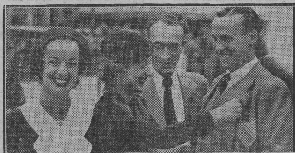
Escenas del domingo: He aquí a dos lindas señoras "atracando" a dos pollos... ¡qué más quisieran ellas que serlo...!

Esperamos pues, que tanto el señor Gobernador civil como la Diputación, sabrán conducirse en estos momentos, como su deber y los derechos de los remolacheros lo demandan.