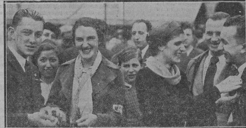
He aquí a otras dos simpátisimas señoras a las que con tanto gusto afean la "tallanga" los agraciados...

Boinas de fabricación Navarra. Venta en todo comercio. Viuda de Alvaro Lorente ESTELLA