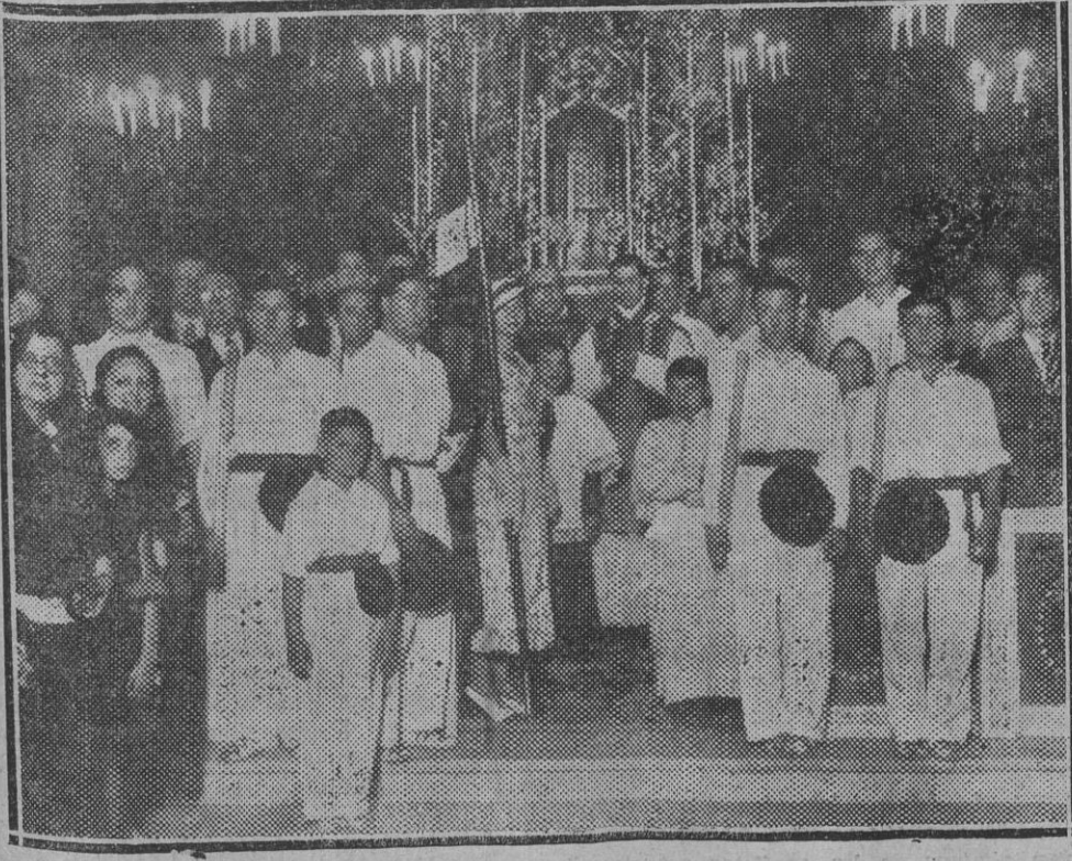
MADRID.—Bendición de la nueva bandera del "Hogar Vasco" en la Capilla de San Ignacio. (Foto Hernando).