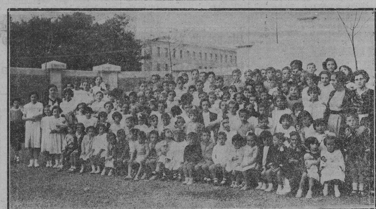
Niños de las Escuelas Vascas reúidos con motivo de la terminación del curso y acompañados por sus profesores.

Se anuncia que el general Roehm se ha suicidado en la cárcel.