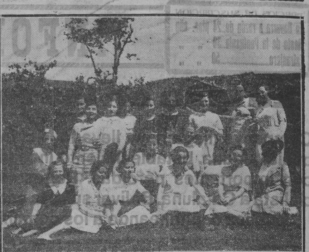
Grupo de alumnas de la Academia Femenina de San Miguel en los altos de Belate durante la excursión que celebraron en motivo de la terminación de curso.