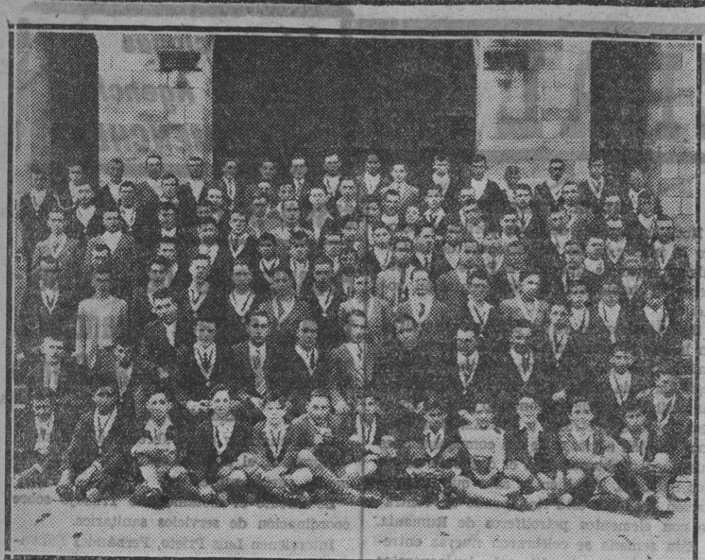
Miembros de la Congregación de San Luis Gonzaga de Elizondo, recientemente constituida, rodeando al señor párroco de la capital baztanesa.