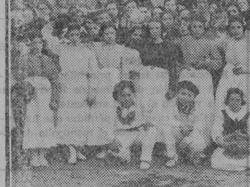
DE LA FIESTA ESCOLAR DE IRURITA: Grupo de dantzaris de Ciga (Baztán)

Después de algunos días lluviosos y fríos en realidad debido a la época del tiempo porque atravesamos, ha amanecido el día de