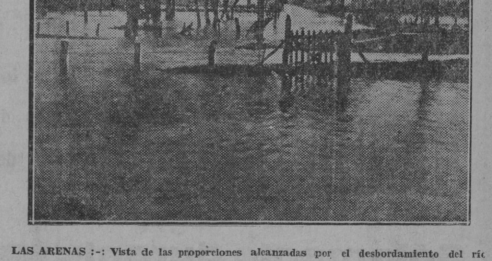
LAS ARENAS :- Vista de las proporciones alcanzadas por el desbordamiento del río Gotelas

En muchas provincias la cosa no tiene vuelta; lo hecho hecho está y a lo hecho, pecho; pero en otras hay que dar otra vuelta a la manzana electoral para ver quiénes son los que en definitiva le hincan el diente; de nuevo pues, en esas atormentadas regiones hay que agitar el censo, empaparlar la vía pública y de trochar saliva y gasolina.