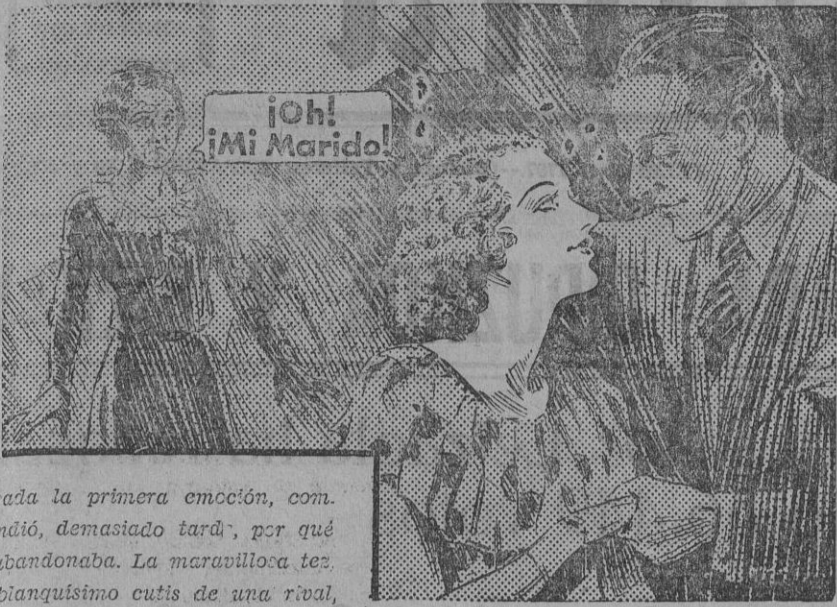
Para la primera emoción, comprendió demasiado tarde, por qué se abandonaba. La maravillosa tez, el blanquísimo cutis de una rival, fueron la única causa de eso.