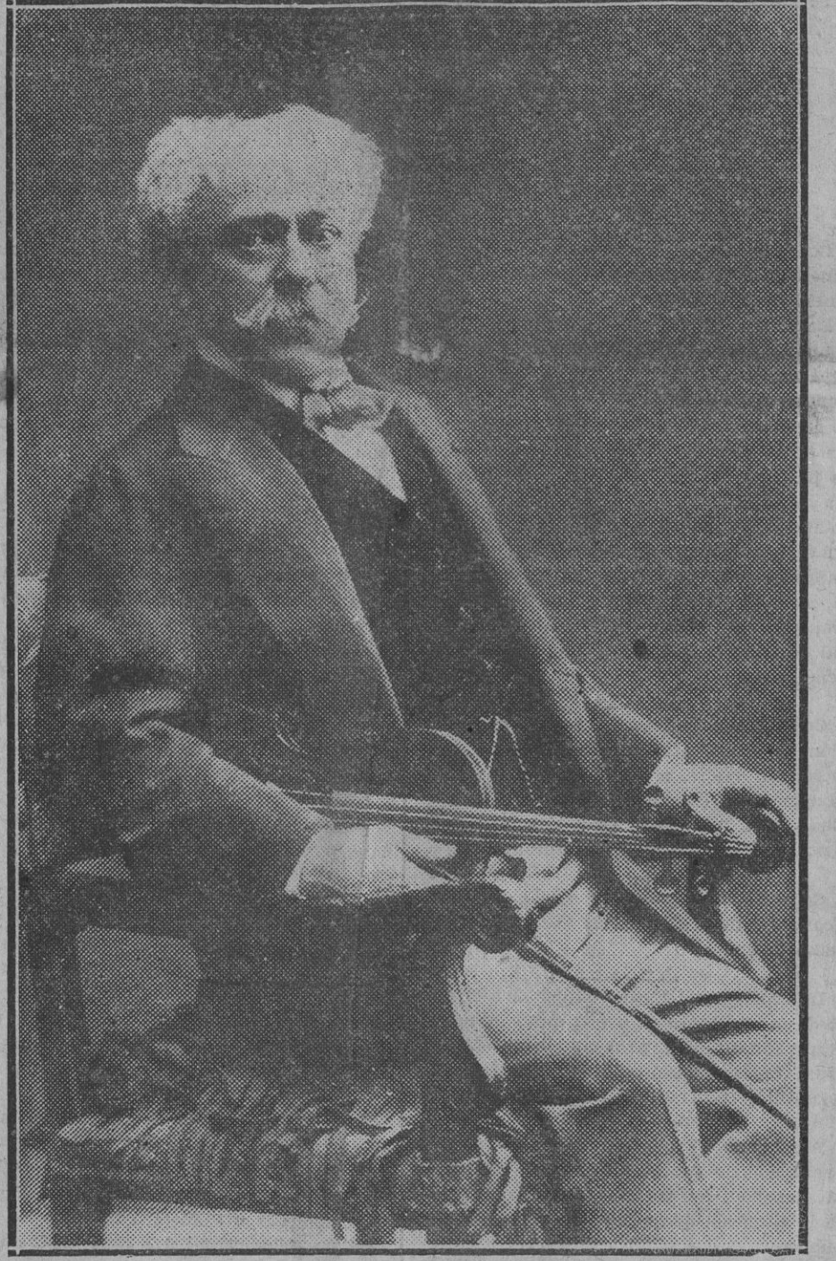
El grande y extraordinario artista navarro, gloria de la raza, al que Iruña, su patria, dedica hoy emocionado y cristiano recuerdo con motivo del XXV aniversario de su fallecimiento.