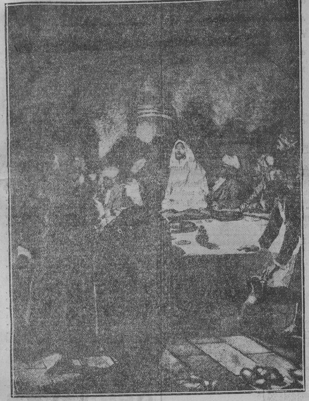
LA CENA (De autor desconocido)

TELEFONO 1797.—Oficinas y Talleres: ZAPATERIA 50 y NUE