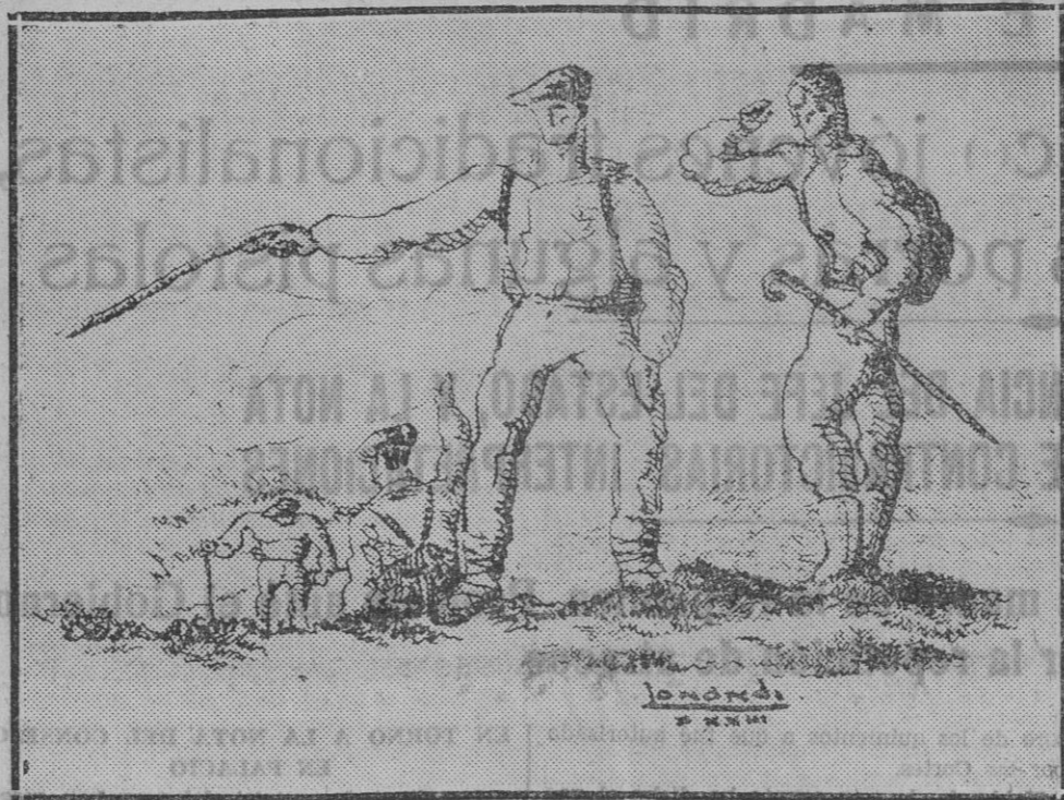
Escena de montañismo vasco. Belle dibujo a pluma

Uno de los directivos del Deportivo Alavés ha dicho lo siguiente: "Hay que esperar a que pase el mal rato. Luego se convocará a una junta general de accionistas y la Directiva preguntará qué es lo que quieren los socios."