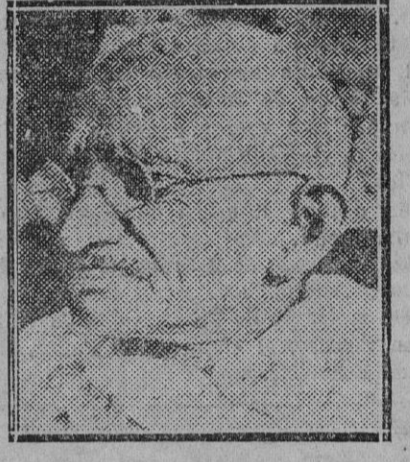
Gandhi, el líder hindú, el cual acaba de poner fin al ayuno que se había impuesto, para reducir al Gobierno inglés a que se acataran los acuerdos de Puna. Las últimas noticias dicen haber sido encarcelado nuevamente.

Gandhi: un cuerpecillo desmedrado, raquítico, de faltar penitente, cuyas aristas se adivinan bajo los pliegues de una sábana blanca. Basta esto para una fotografía de Gandhi; pero aún hay más... Su boca: cuando Gandhi se ríe, parece que por esa boca desdentada se le rajaría todo el rostro si no fuera el tope de las orejas; unas orejas que la aridez del cráneo lavado hace más grandes. Y su expresión, hasta cuando se arruga de sonrisas ante los fotógrafos, aquel rostro bronceado por el sol de setenta y tres otoñosas tiene la nueca trágica de un lobo oriental. Tan solo dos blasfemias de modernismo descomponen su figura antigua; un reloj-