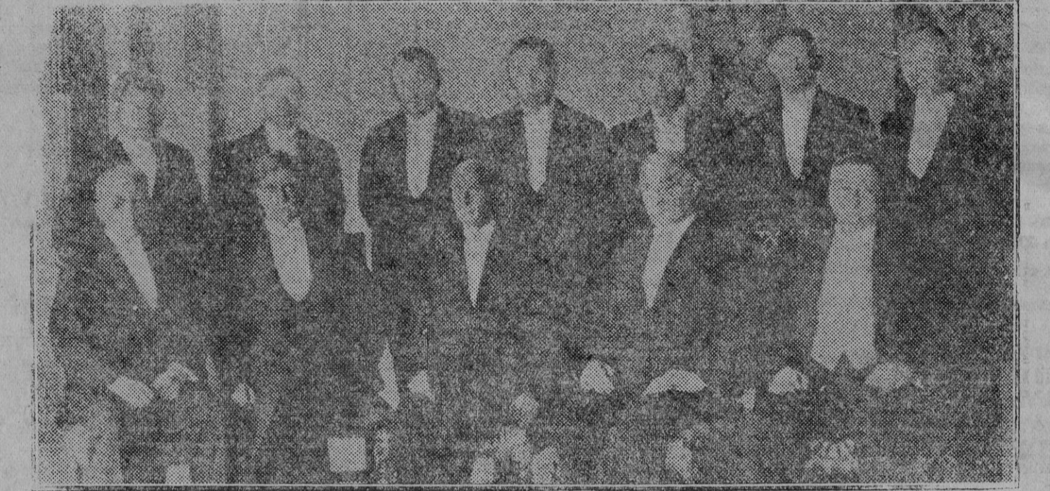
STOKOLMO.—El nuevo Gobierno sueco.