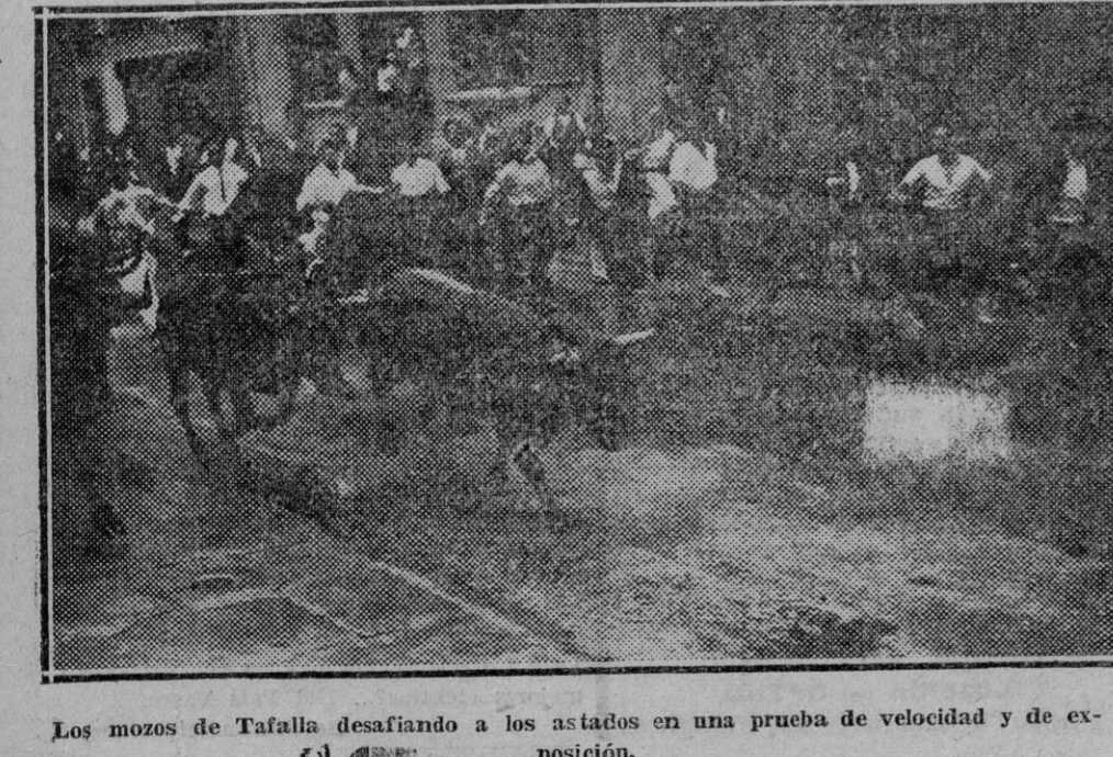
Los mozos de Tafalla desafiando a los astados en una prueba de velocidad y de exposición.