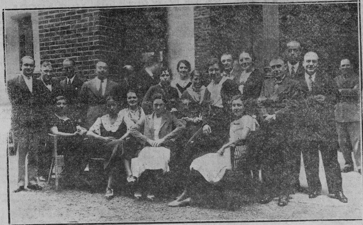
Nota gráfica de la interesante excursión realizada por los distinguidos facultativos de Pamplona al Balneario de Betelu.