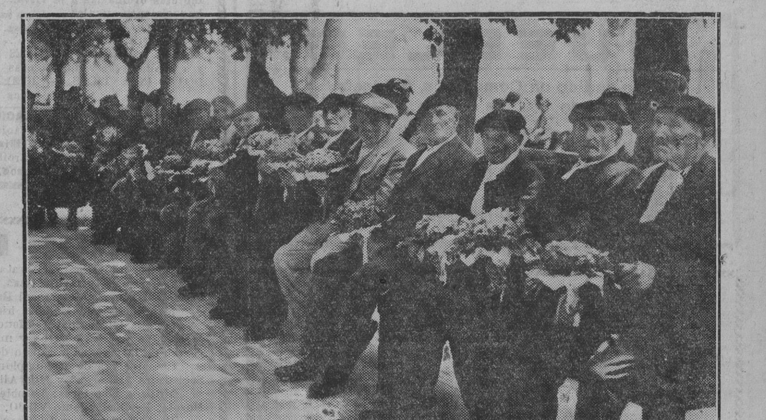
Grupo de ancianos de los homenajeados en la fiesta de ayer