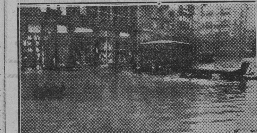
Formidable temporal en Santander, el cual ha inundado las calles, deteniendo a camiones y vehículos

Lérida.—En el comedor del hospital explotó un hornillo re bendina, resultando un niño muerto y una Hermana de la Caridad, un practicante y cuatro niñas heridos.