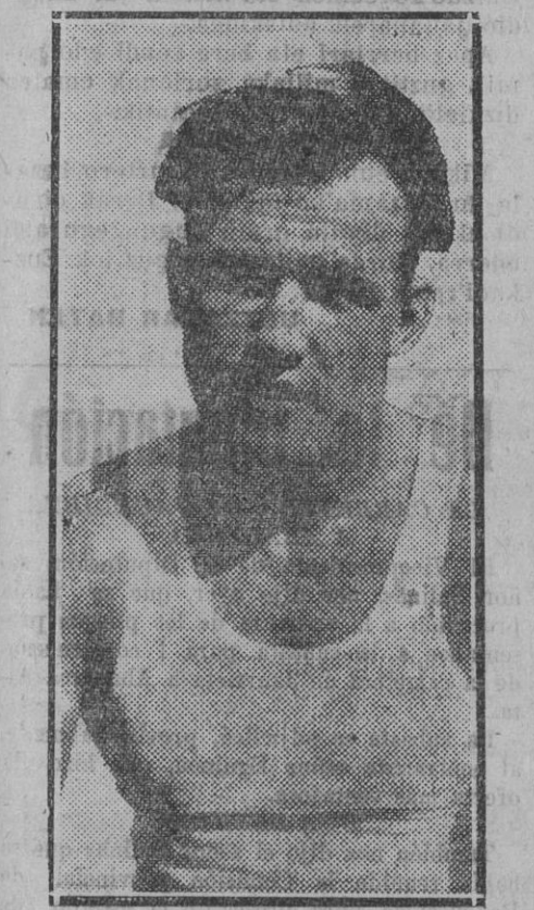
SHARKEY, campeón mundial de boxeo, por derrota de Schmelling.