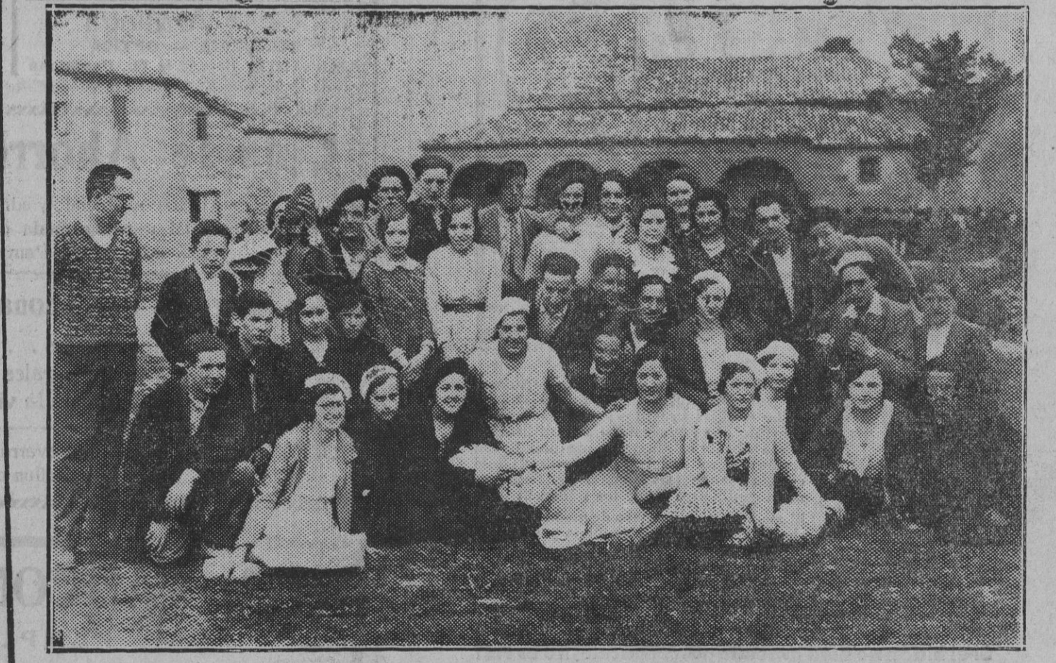
Interesante grupo de bellísimas señoritas y animosos jóvenes de Pamplona que se trasladaron anteayer al vecino pueblo y que cantaron en la función religiosa, la cual se celebró con gran solemnidad y concurrencia