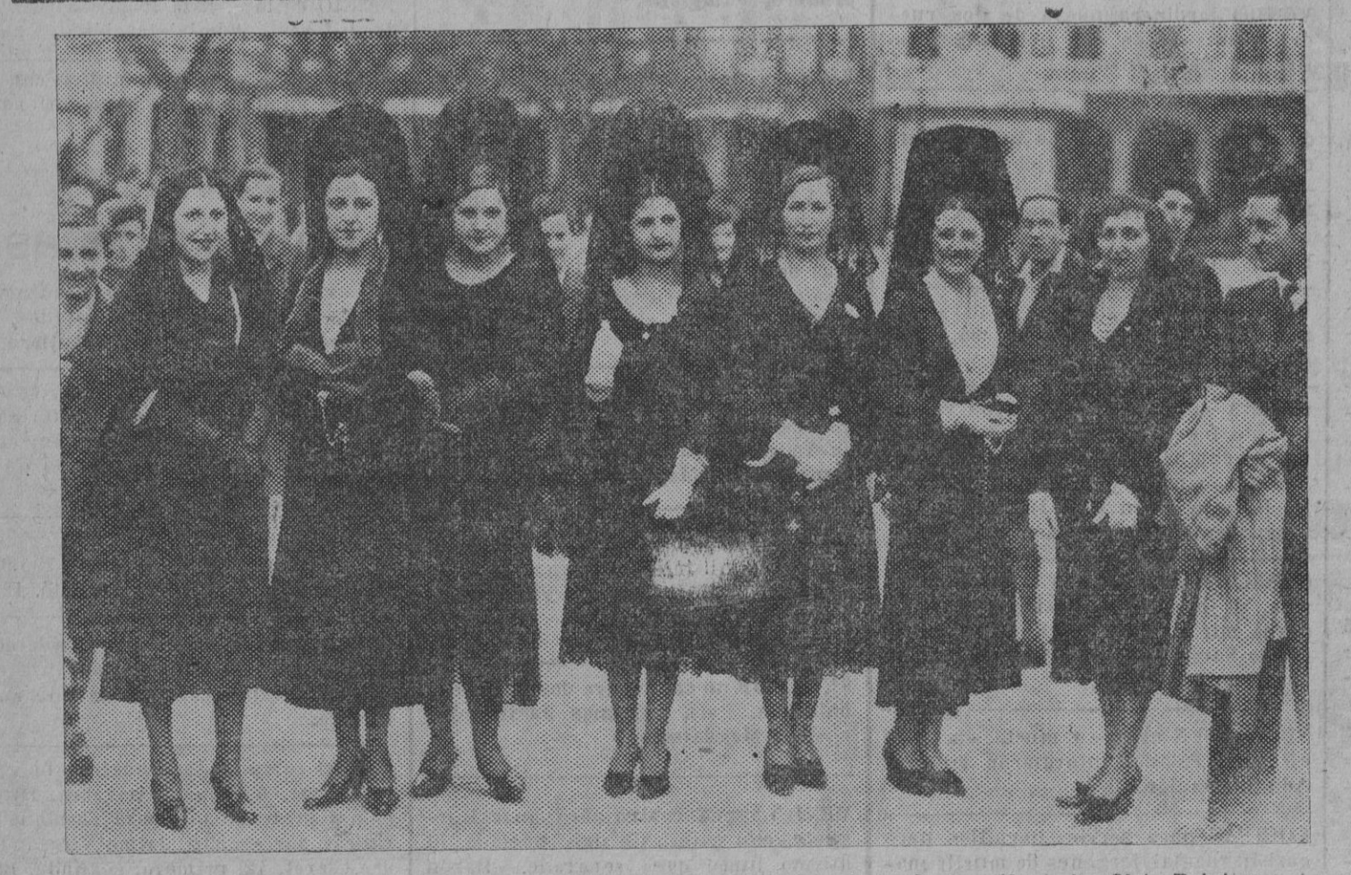
El desfile de la Catedral.—Grupo interesante de bellas devotas, después de salir de las Siete Palabras.