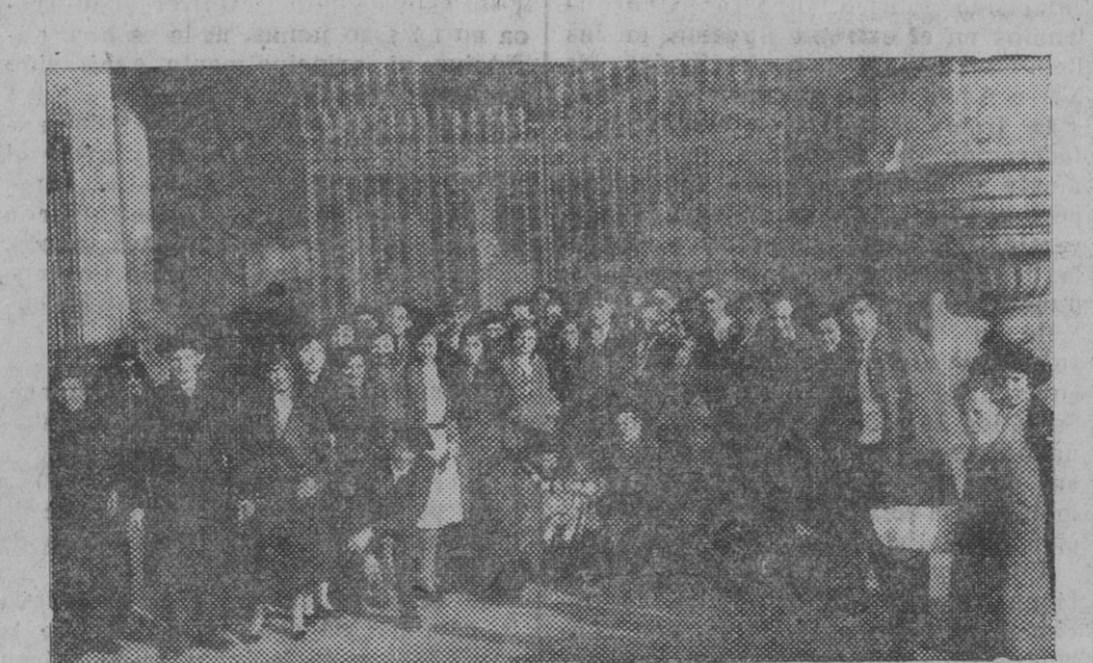
Los novios e invitados, después de la ceremonia nupcial (Foto K. Llisqui).