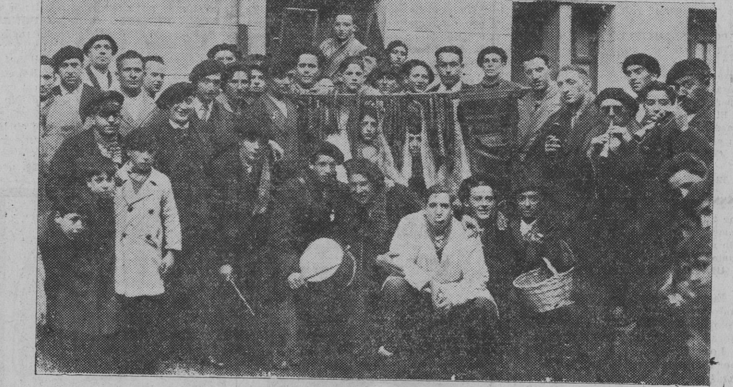
Los matarifes que ayer, siguiendo costumbre tradicional, recorrieron las tócinerías de nuestra ciudad..

Se tiñe, curte y confecciona todas las clases de peltería en LA ARAGONESA BLAS VALERO Sapl. 8 — Tel. 2020 — Zaragoza