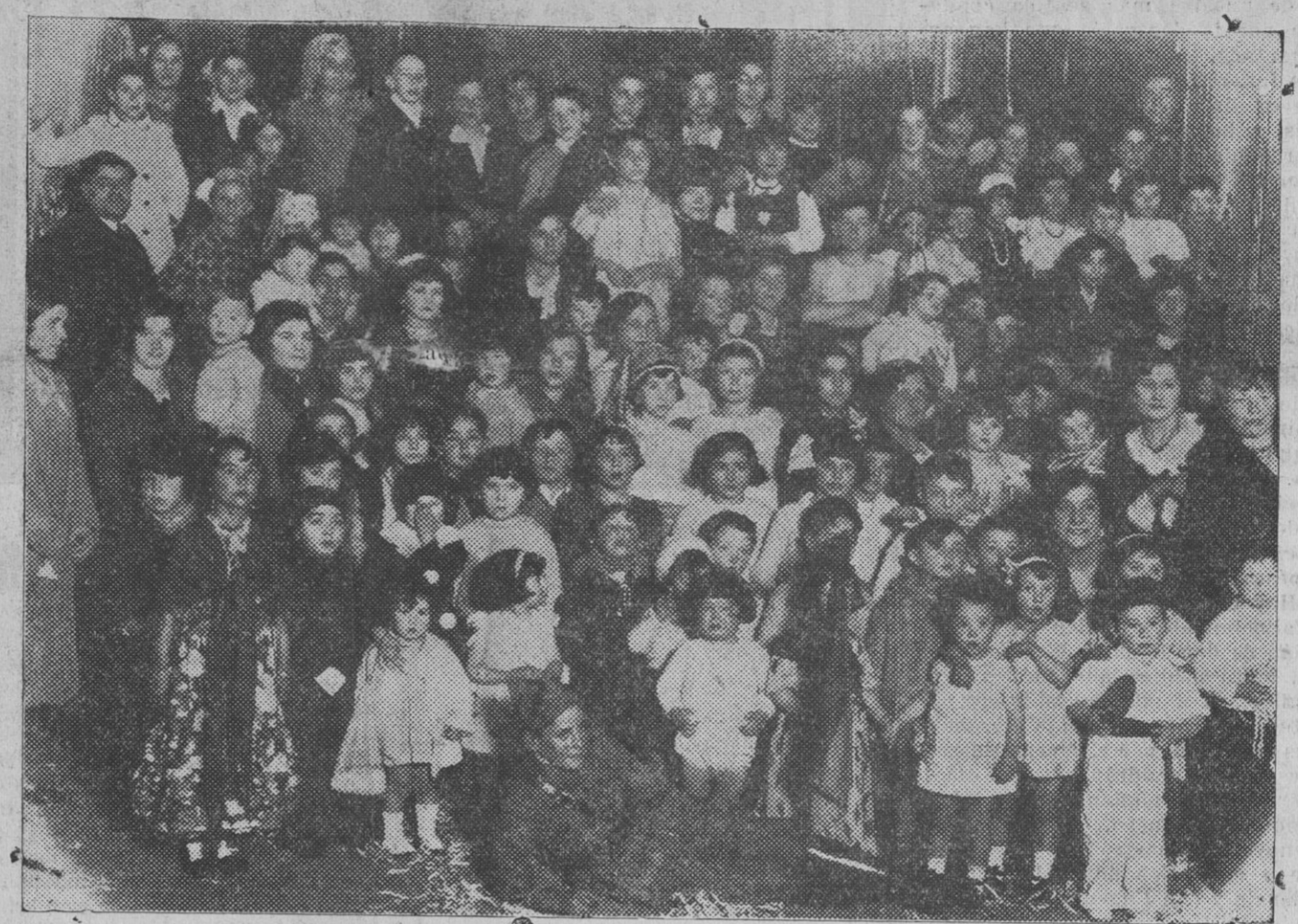
Grupo de niños que acudieron ayer al baile infantil que se celebró en el Casino Militar de Clases.