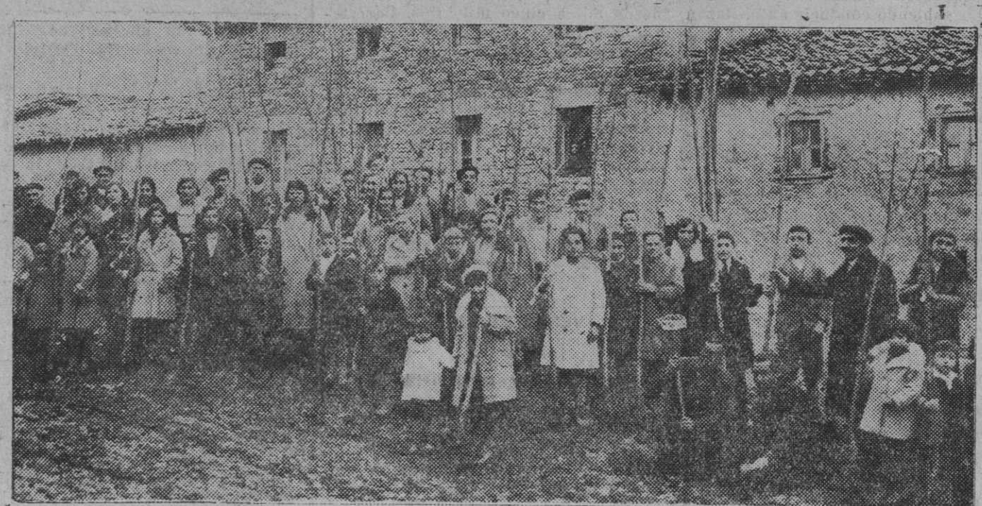
DE MUTILVA.—Niños y niñas preparándose para la plantación de árboles el día de la Fiesta del Arbol, recientemente celebrada

Y muchas preocupaciones desaparecieron en ciertos izquierdistas, si conociesen mejor el espíritu de libertad y de respeto a la conciencia individual que informó a Vasconia. ¿Cuánto podría decirles sobre esto que ciertamente les sorprendería. Nuestro pueblo antecedió a todos los de Europa y fué maestro en libertad y democracia, de todos ellos, y resistió a lo que el ambiente general imponía.