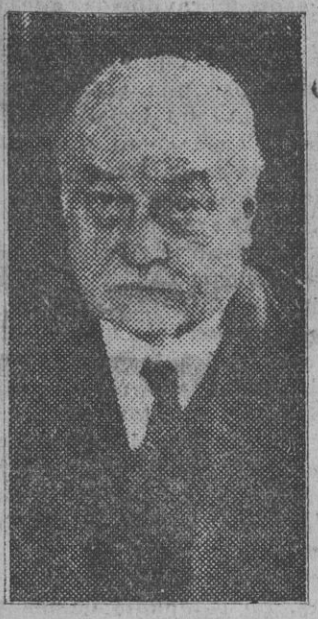
En la última reunión del Instituto Nobel, celebrada en Oslo (Suecia), se ha acordado conceder el Premio Nobel de la Paz 1931 a la señorita Juana Adams, fundadora de la Casa de Hull, de Chicago, y a Mr. Nicholas Murray Butler, presidente de la Universidad Columbia, de Nueva York