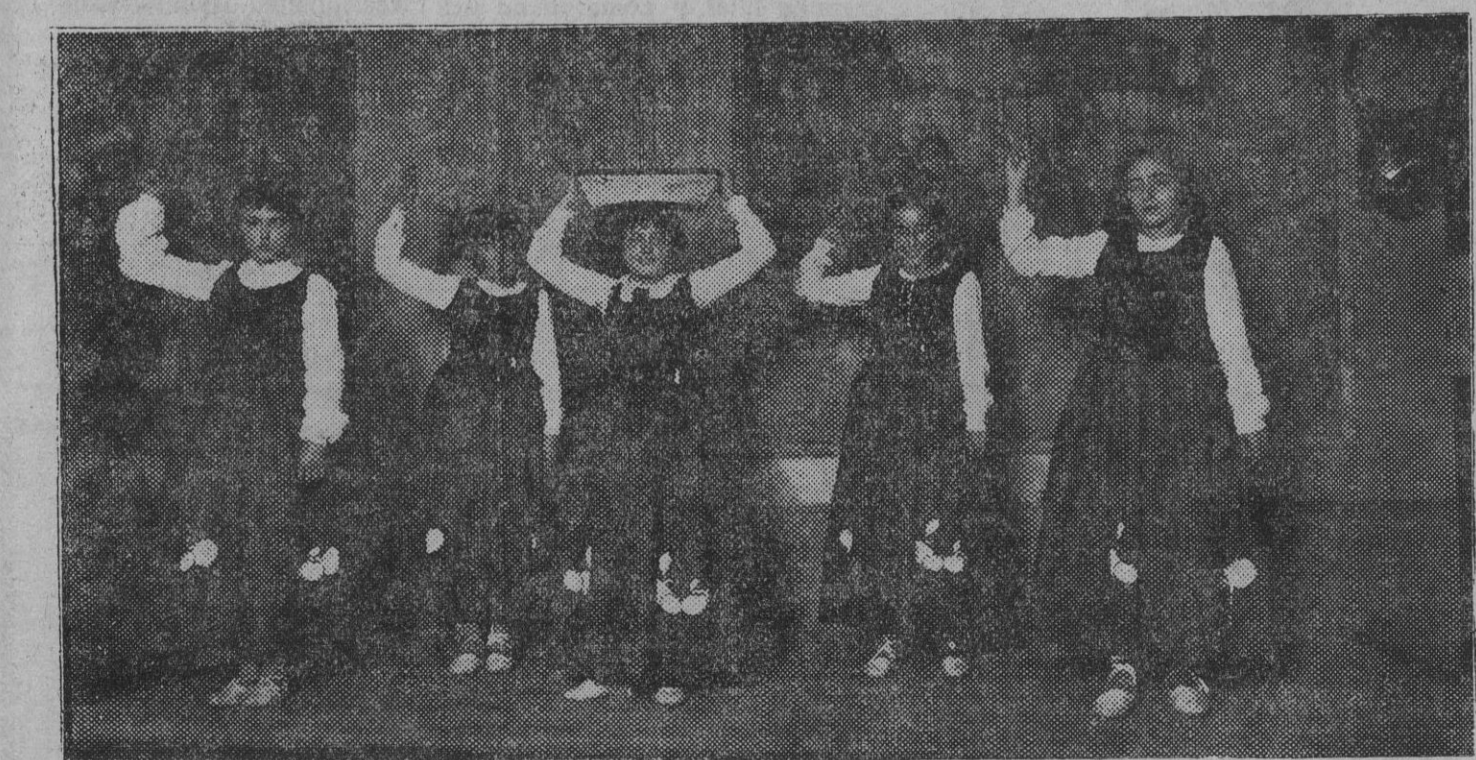
Encantadoras "neskatillas" que participaron en la fiesta de Reyes celebrada ayer en los locales del Centro Vasco de esta ciudad.

(Retirado de nuestro último número por falta de espacio)