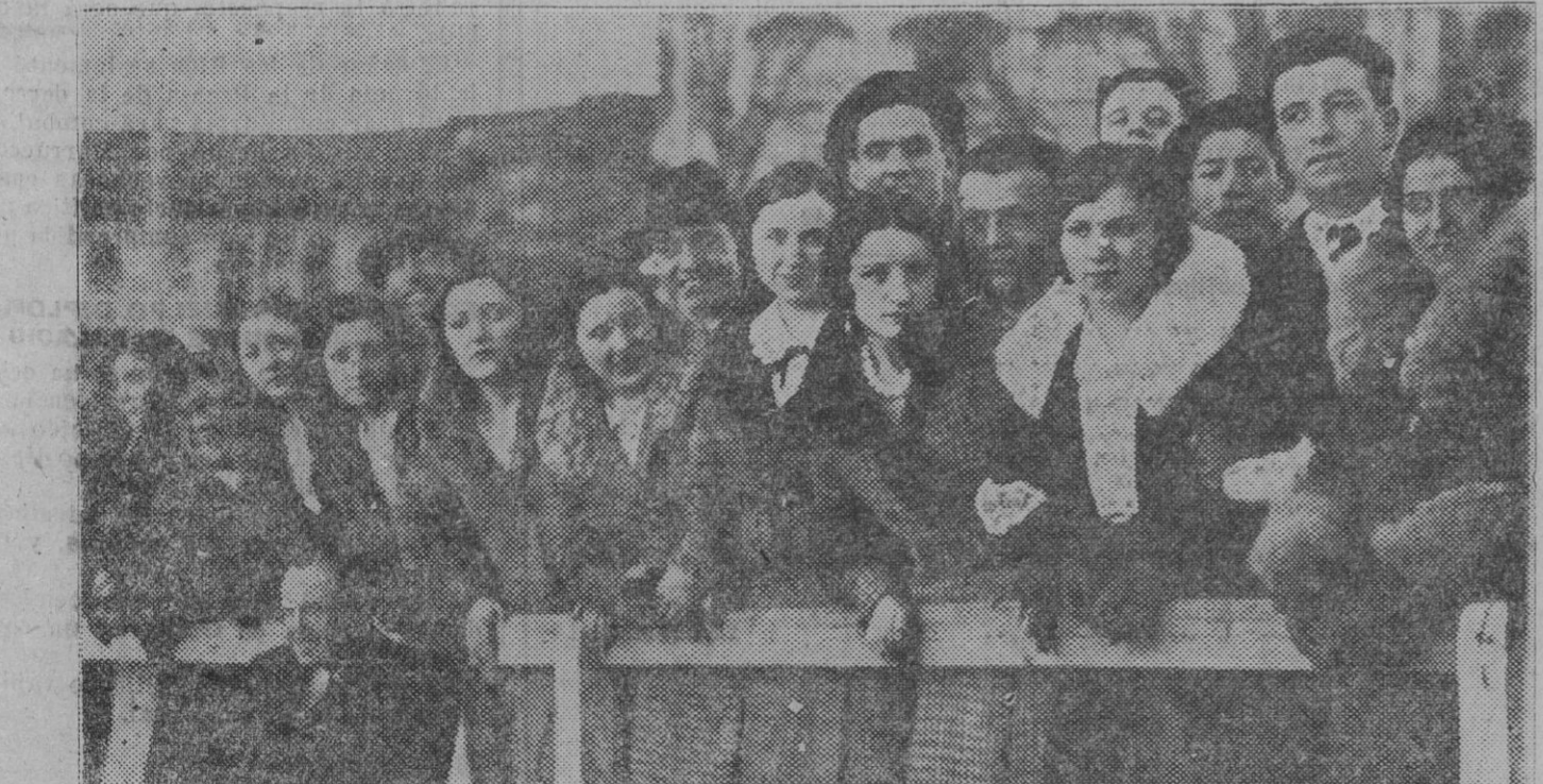
Aspecto de la preferencia durante el partido de liga disputado el domingo entre el Aurora y Osasuna (Foto Gerardo Zaragüeta).