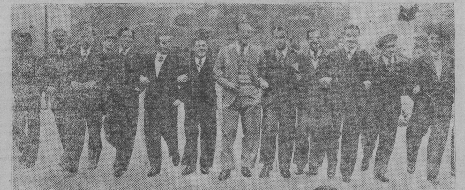
UN ALEGRE PASEO POR TRAFALGAR SQUARE.—Los futbolistas del equipo nacional español llegaron a Londres y recorren la capital en animado grupo. Helos aquí, con Zamora en el centro, pasando alegremente por Trafalgar Square.