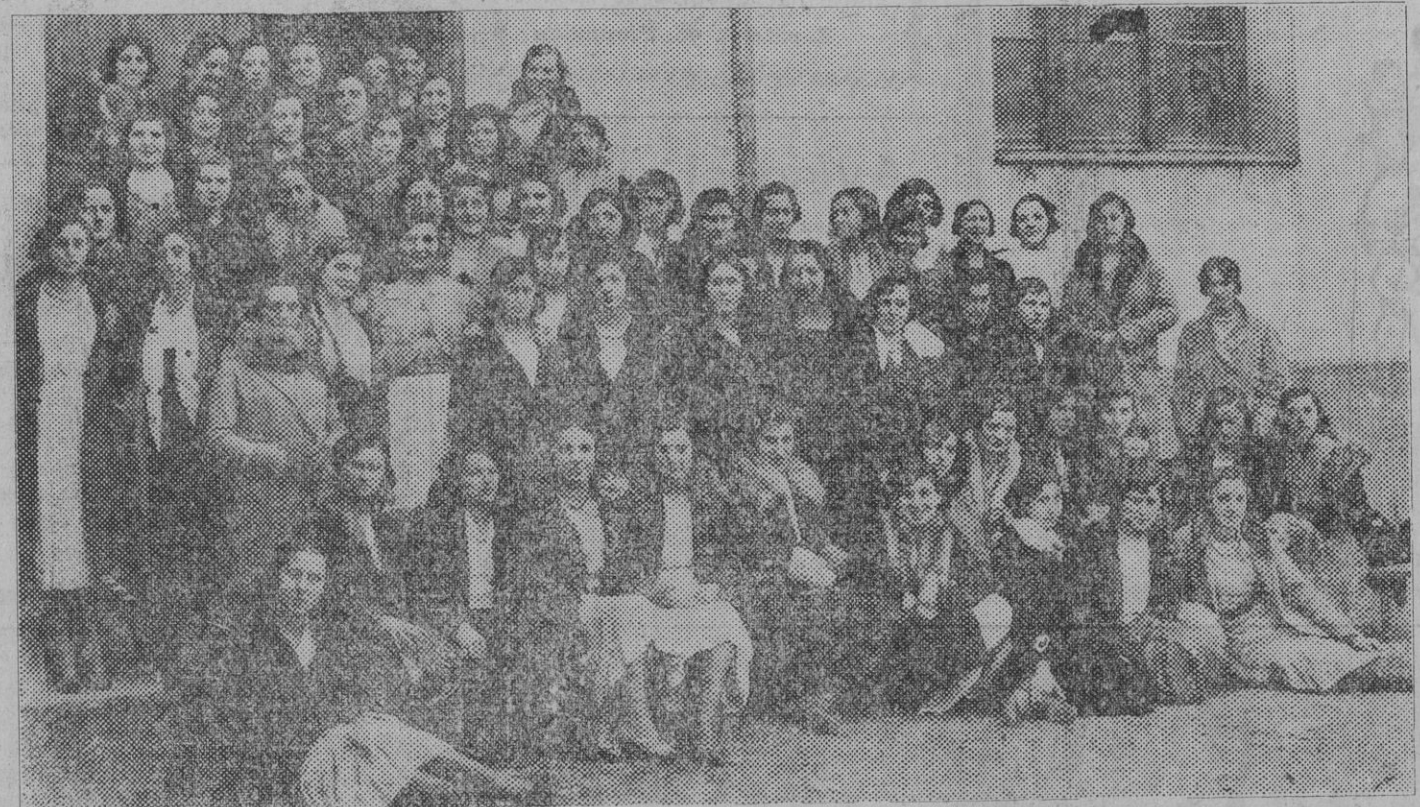
Profesoras y alumnas en la inauguración de la Escuela del Hogar, que tuvo lugar ayer.