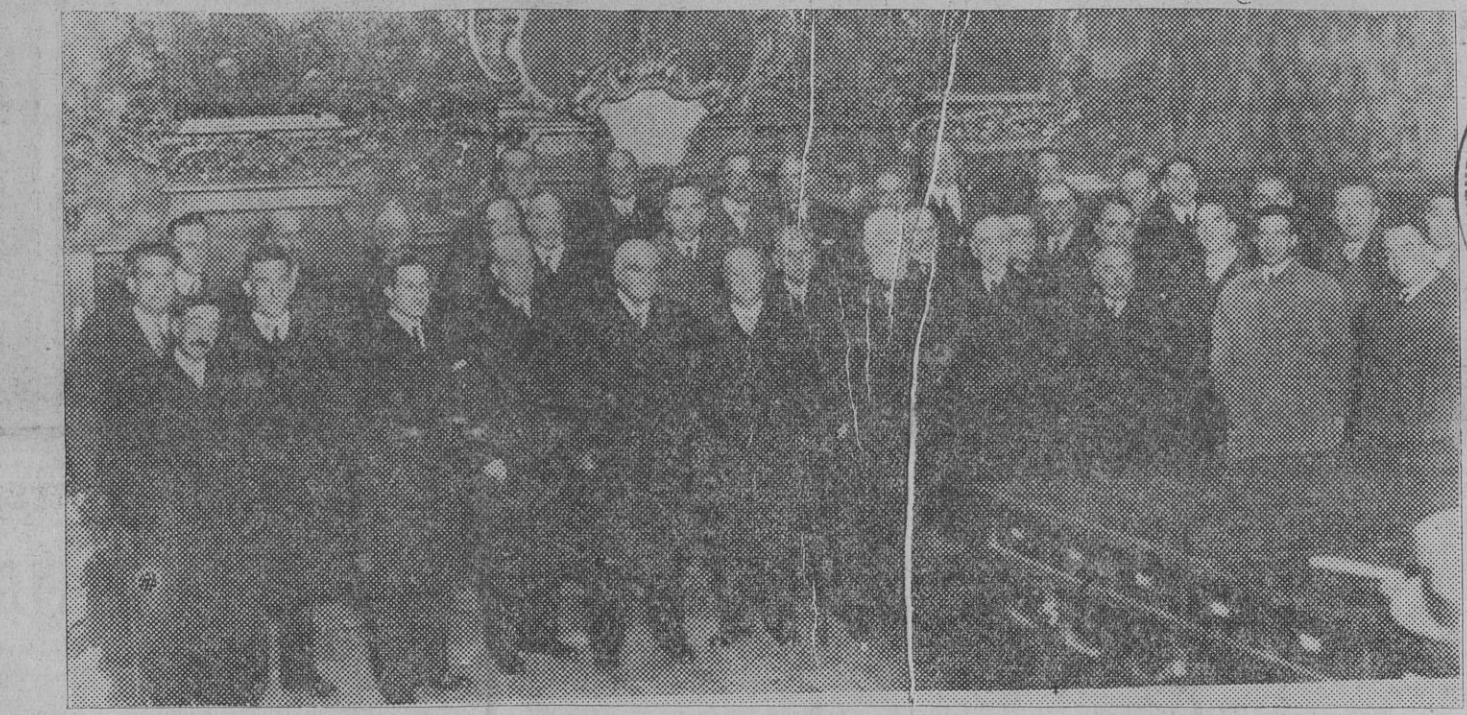
Los organizadores de la función religiosa de San Francisco Javier, Patrono de Navarra. (Foto Zaragüeta).

EN OCTAVA PAGINA Movimiento nacionalista