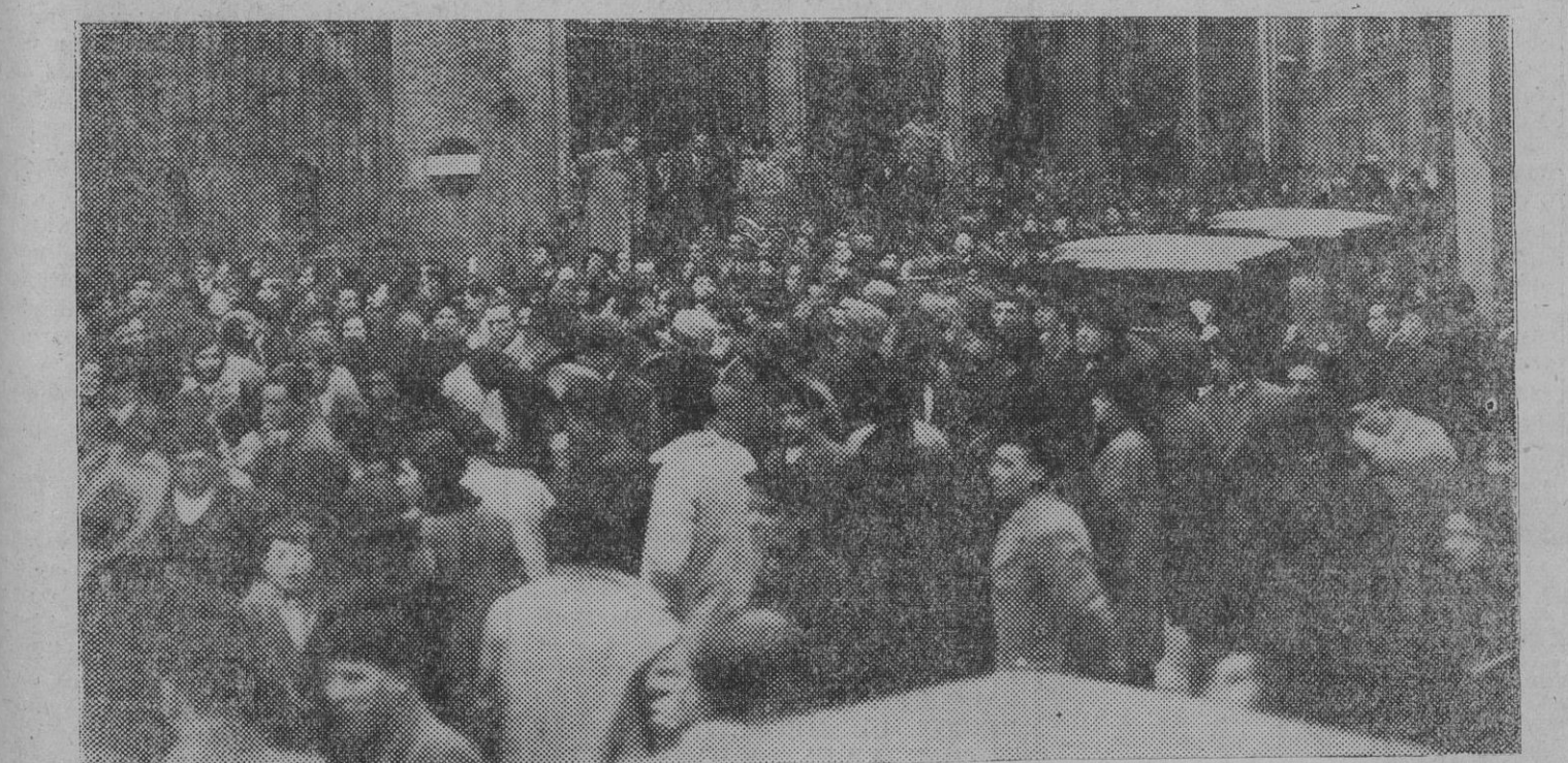
El público saliendo de la función de San Francisco Javier.

Dr. J. LUCEA VILLAR Enfermedades de la sangre y secreciones internas (Diabetes, hocio, obesidad, etc.) Análisis de sangre Medicina general AVENIDA CARLOS III, 16, 2. Teléfono 1015