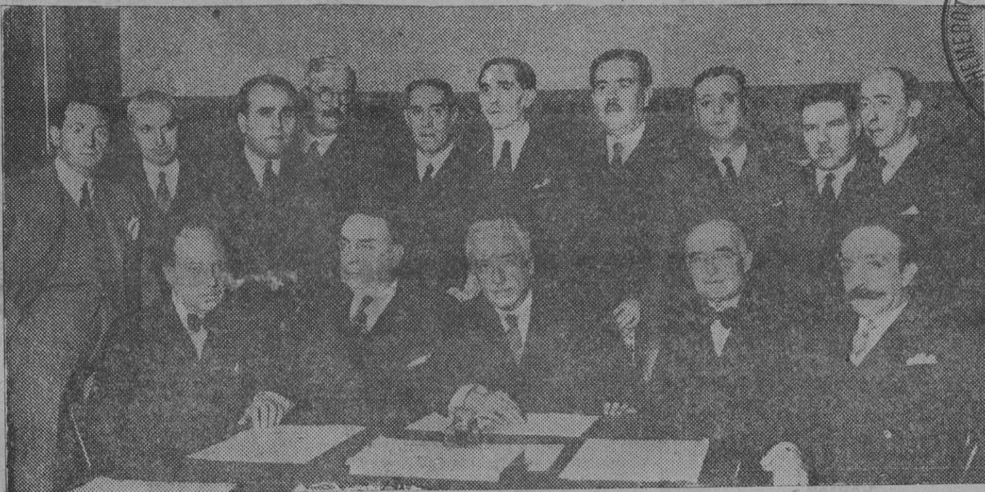
El señor Alcalá Zamora, dando cuenta a la minoría progresista del ofrecimiento que le ha sido hecho por los ministros para la presentación de su candidatura a la presidencia de la República