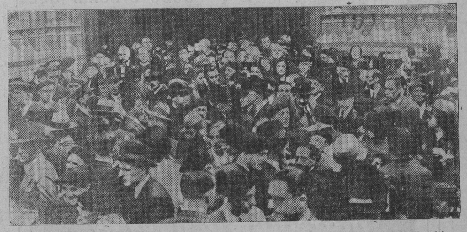
La concurrencia saliendo de la Iglesia de Santiago de Bilbao, después de los funerales por el alma de don Jaime de Borbón

Quito.—Después del triunfo del movimiento revolucionario registrado en el día de hoy, a consecuencia del cual ha sido depuesto de su cargo el presidente de la República, coronel Luis Larrea Alba, ha sido designado para desempeñar estas funciones el señor Alfredo Baquerizo Moreno, presidente del Senado.