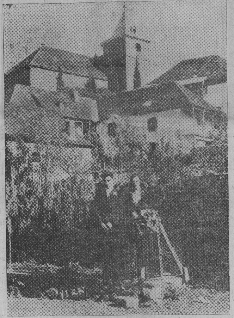
EZCAROZ.—Los nuevos esposos Arana-Roda